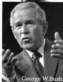
George W. Bush