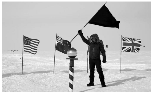
Bendera hitam di Kutub Selatan. Seniman Santiago Sierra [lihat lampiran] membantu mengoordinasikan penempatan bendera hitam di Kutub Utara dan Kutub Selatan pada tahun 2015, sebagai bentuk pembangkangan terhadap kolonialisme nasionalis.

Mungkin tidak diberikan kepada siapa pun untuk bertindak berdasarkan kepekaan orang lain untuk membentuk dan memperbesar kesadaran itu, kecuali dengan harga menawarkan dirinya sebagai pengorbanan bagi semua kekuatan jiwa yang tersebar di masanya: kekuatan yang, pada umumnya, hanya mencari satu sama lain dalam upaya untuk saling mengucilkan. Dalam pengertian inilah orang seperti itu, selalu dan, dengan keputusan misterius dari kekuatan-kekuatan ini, harus pada saat yang sama menjadi korban dan algojo mereka. Dengan demikian, hal yang sama juga terjadi dalam hal selera kebebasan manusia yang, yang dipanggil untuk memperluas bidang penerimaannya kepada semua orang dalam proporsi yang praktis tak terbatas, menarik semua konsekuensi mengerikan dari yang berlebihan pada satu orang. Kebebasan tidak menyetujui untuk membela bumi ini kecuali dengan mempertimbangkan mereka yang telah mengetahui, atau setidaknya, sebagian mengetahui, bagaimana cara hidup jika mereka telah mencintainya hingga ke titik kegilaan.