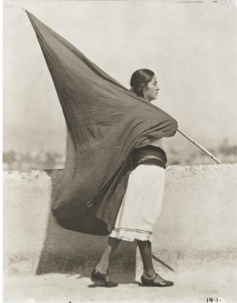
Tina Modotti, “Woman with Flag”-sebuah foto seorang wanita yang berjalan “ dengan bendera hitam Anarcho-Syndicalist ” di Mexico City pada tahun 1928.