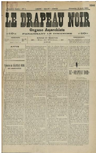
Edisi perdana Le Drapeau Noir, 12 Agustus 1883.