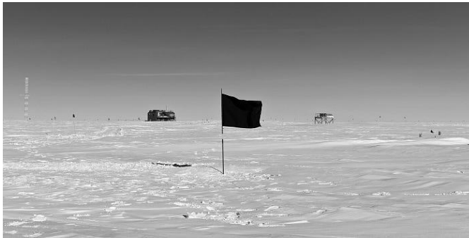
Sebuah bendera hitam di Kutub Selatan.

Di sini, kerumunan orang berkumpul di tengah alunan lagu [lagu revolusioner Prancis] 'Marseillaise,' pengibaran bendera hitam dan merah, dan sorak-sorai kaum proletar yang benar-benar menderita."