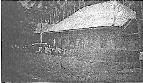
Sekolah Pemerintah di Kuala Simpang, 1935

Lheue (Banda Aceh), dan Teuku Zainal Abidin yang menjadi guru di Susoh (Aceh Barat Daya). 12