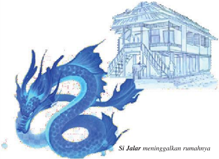
Si Jalar meninggalkan rumahnya

mendekatkan kepalanya kepada ibu yang sangat ia cintai.