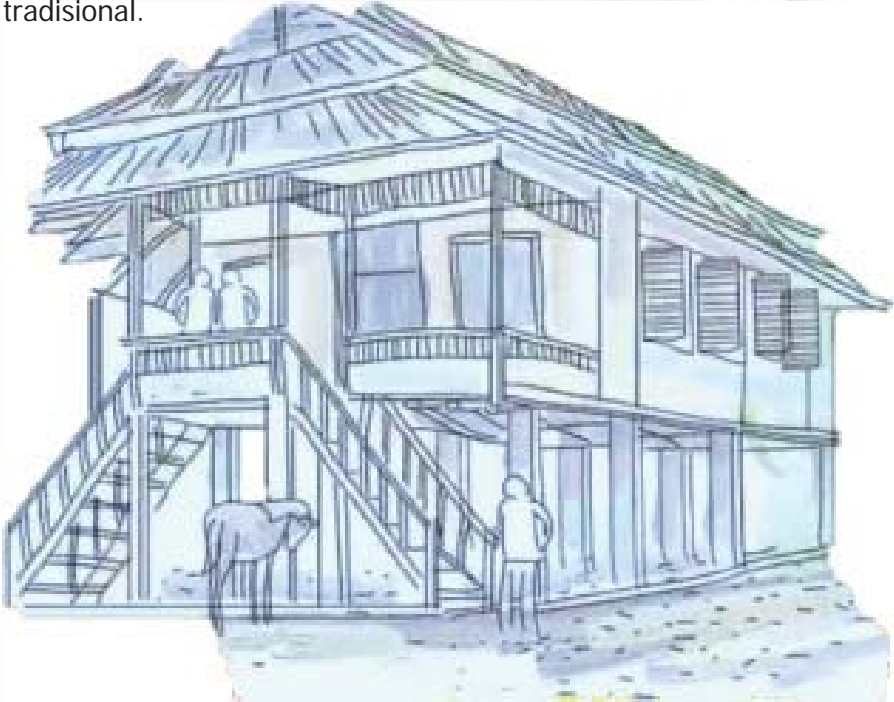
RUMAH panggung di tepian sungai

Tinggi lantai dari permukaan tanah sekitar satu sampai dua meter. Mereka membangun rumah dengan peralatan sederhana secara tradisional.