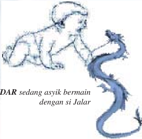
SI KANDAR sedang asyik bermain dengan si Jalar

Setiap hari si Jalar menghabiskan waktu bersama adik dan kedua orang tuanya. Ia selalu menemani si Kandar tidur pada pagi atau siang hari. Bahkan ketika malam pun ia tidur bersama kedua orang tuanya.