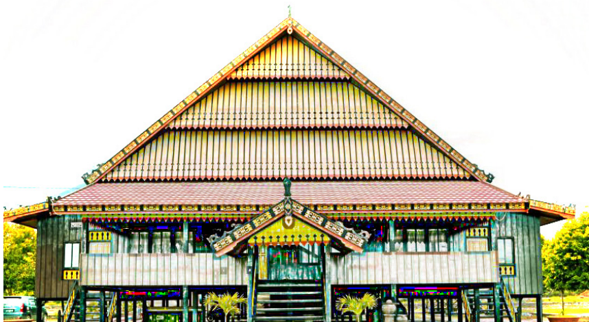
Rumah adat Mekongga Kolaka