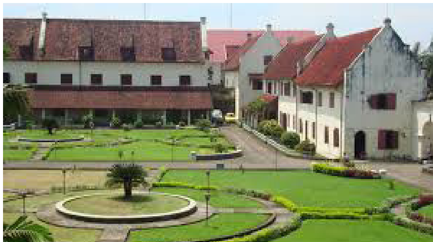
Benteng Fort Rotterdam Makassar.

Sultan Hasanuddin tidak dapat lagi mempertahankannya, karena posisinya yang strategis, Belanda kemudian membangun Benteng Ujung Pandang dengan penataan sesuai dengan arsitektur Belanda. Di dalam area benteng terdapat beberapa bangunan sebagai pusat pemerintahan. Sejak saat itu, nama benteng pun berubah menjadi Fort Rotterdam . Pemberian nama pun berdasarkan kelahiran pimpinan Kolonial Belanda, yakni Cornelis Speelman di Belanda.