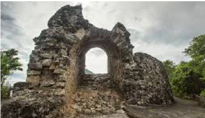
Benteng Otanaha Gorontalo dibuat dari campuran telur burung maleo

Benteng Otanaha terletak di Kota Gorontalo, tepatnya di Kelurahan Dembe. Benteng ini dibangun pada zaman Portugis semasa kerajaan Ilato. Benteng dibuat atas 3 bangunan terpisah. Berdasarkan sejarah tiga benteng tersebut masing-masing Otanaha, Otohiya, dan Ulupahu. Penamaan benteng tersebut ternyata diambil dari 3 orang putra Raja Ilato. Benteng tersebut dibangun pada abad 15 dengan pengaruh arsitektur Portugis dengan menghadap