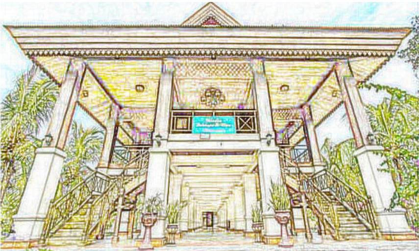
Rumah Adat Dulohupa Gorontalo

Rumah ini dilengkapi dengan dua tangga, yaitu tangga yang berada di bagian kiri dan kanan rumah yang menjadi simbol tangga adat atau disebut tolitihu . Pada zaman kerajaan rumah adat ini dibuat berdasarkan simbol pengabdian ikrar persatuan dua kerajaan Raja Gorontalo dan Limboto. Banyak versi atas simbol-simbol yang ada pada artistik rumah adat.