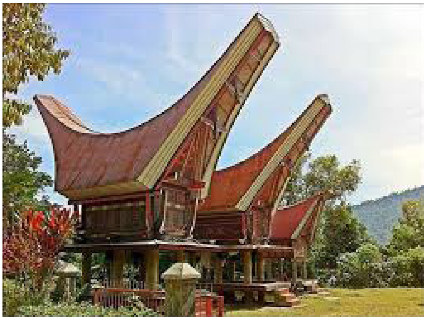
Rumah Adat Tongkonan Toraja

adat Tongkonan juga dapat tahan hingga ratusan tahun. Rahasia dibalik kokohnya rumah adat ini adalah bahan. Bahan dasarnya kayu pilihan atau kayu aru atau kayu besi yang umurnya juga dapat dibilang puluhan tahun. Pengambilan pohon sebagai bahan dasar rumah pada saat itu, diambil secara adat. Hal ini pula sebagai penghargaan kepada alam. Bukti bahwa rumah adat Tongkonan yang masih berdiri kokoh dan diperkirakan umurnya sudah kurang lebih 700 tahun dan beratapkan batu, berada di Desa Banga Kecamatan Rembon Kabupaten Tana Toraja.