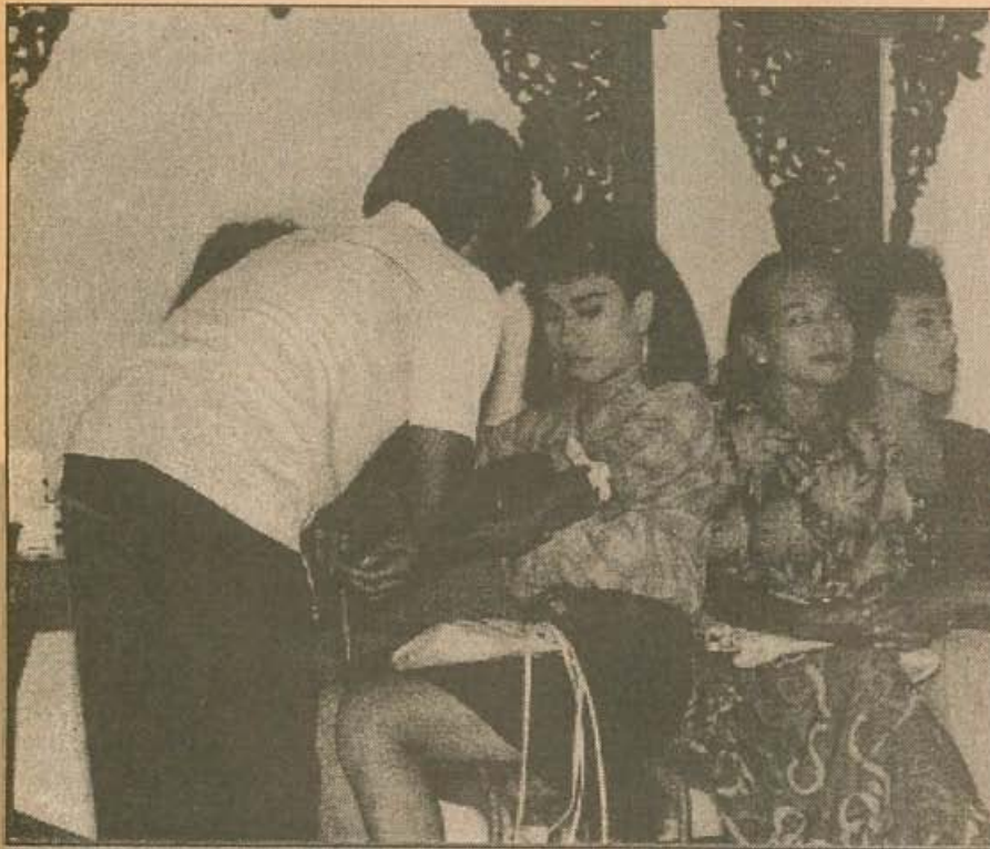
● Pemeriksaan darah para waria Tidak takut dengan AIDS