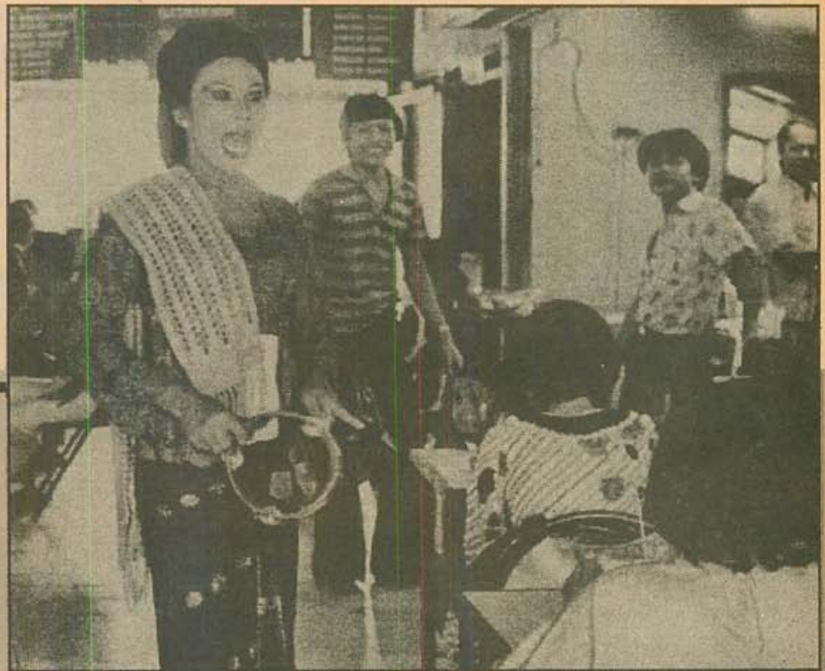
• Menjadi seorang pengamen Karena didorong kebutuhan

Sifat waria yang tidak terorganisasi itu juga yang membuat waria merupakan kelompok yang paling ting-