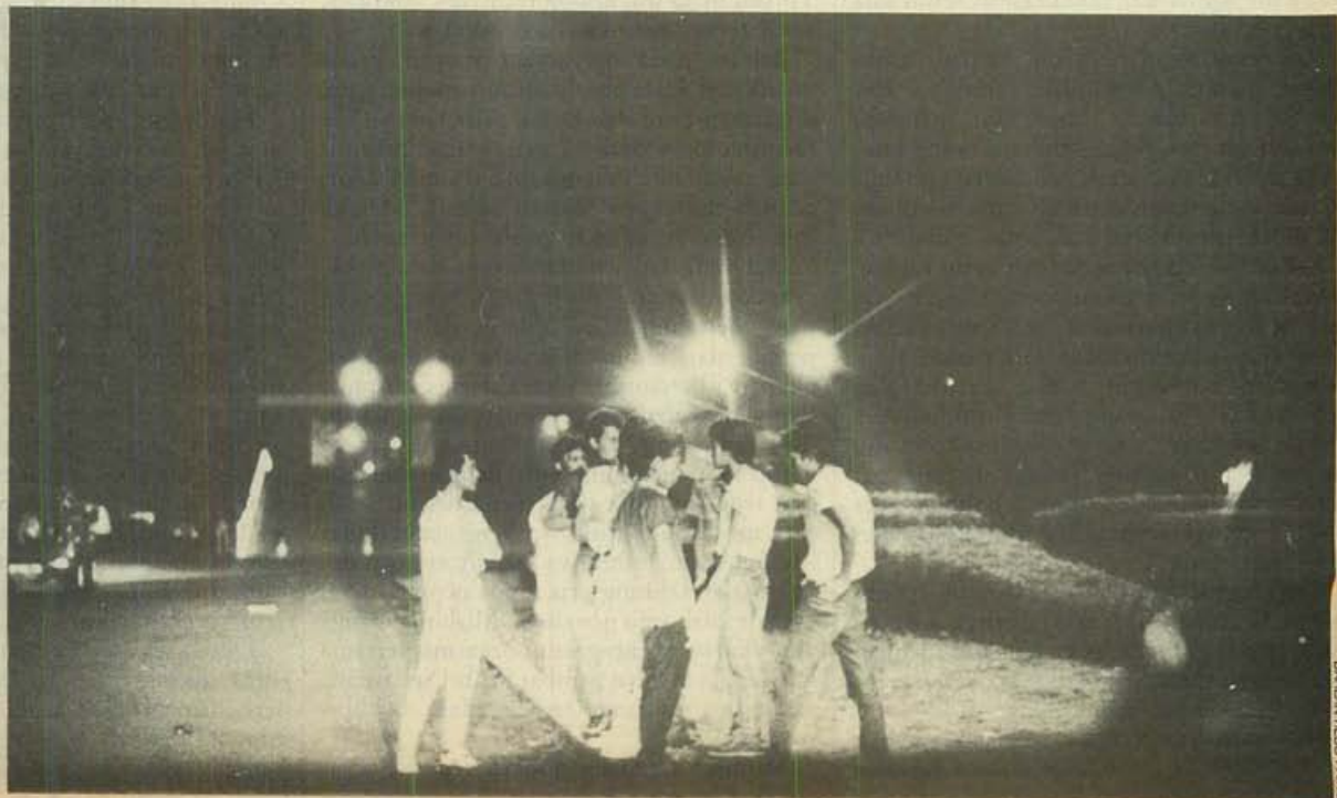
Gay bermalam ria di bawah Tugu Pembebasan