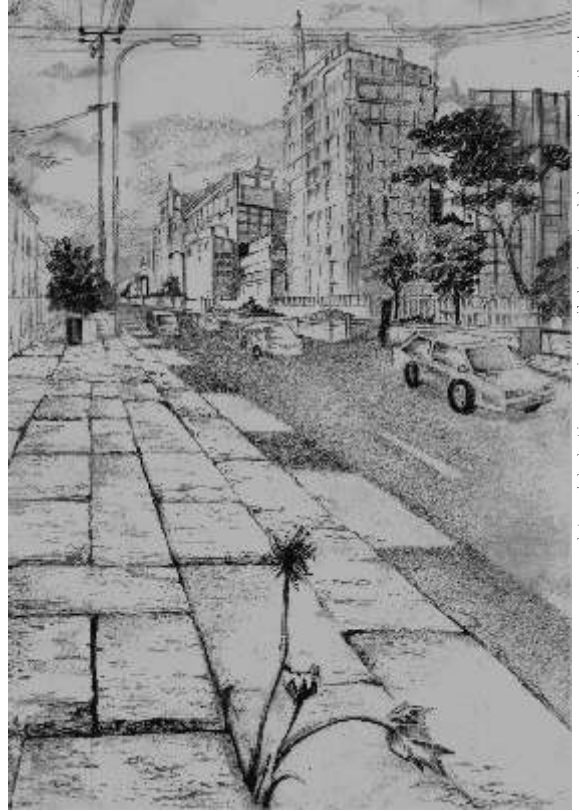
amazing pencil drawing artwork by azura pectura. thanks!