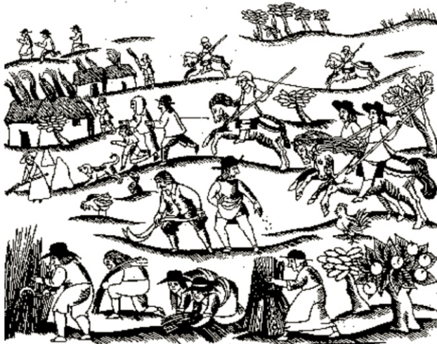
Ilustrasi para Diggers ketika diserang oleh otoritas dan para Cavaliers

"England is not a free people, till the poor that have no land, have a free allowance to dig and labour the commons..." Gerrard Winstanley, 1649