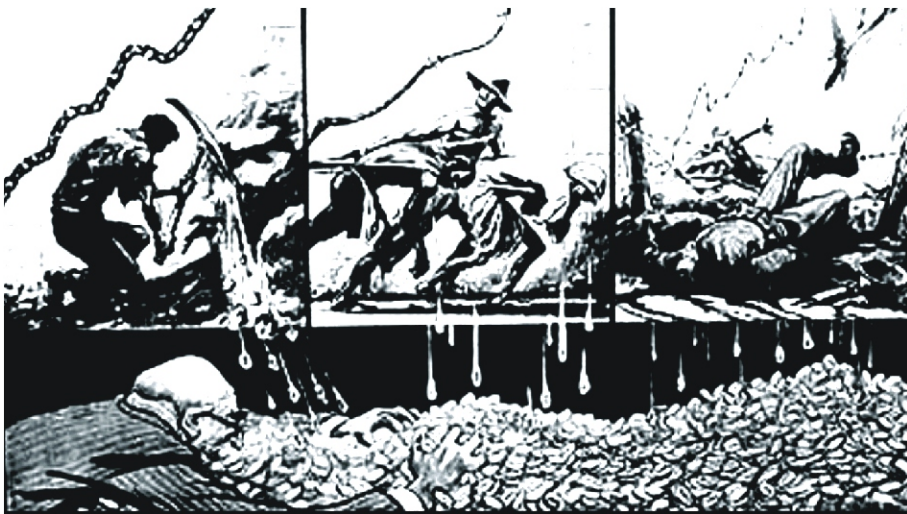
The deconstructionist and postmodernist view of capitalism.

Apabila membaca majalah "Pembebasan" (sebuah terbitan dari Partai Leninis Indonesia a.k.a Partai Rakyat Demokratik) ditunjukkan untuk mencari suatu titik terang dari amnesia histories tersebut, maka pilihannya adalah hitam dan putih. Partai ini mengkritik Stalinisme dan membela Lenin, namun keduanya menyatakan perbedaan di dalam ekspresi yang sama: mereka masih sama-sama percaya bahwa partai mereka harus berkuasa, kapitalisme korporatik harus digantikan dengan "Negara proleter", dan kesadaran pekerja tidak dapat melampaui kesadaran partai; sebuah etos satu komando, satu kekuasaan dari atas kebawah melalui agen-agen partai, yang lebih pantas disebut sebagai "kediktatoran partai." Leninisme masih bisa berkamufase, imej Stalinisme masih menjadi oposisi kapitalisme barat, tapi setelah tembok berlin runtuh dan beralihnya Negara-negara blok timur menuju 'tatanan dunia baru' di awal pasca 60an, semua romantisme revolusi 1917 terbukti sebagai kesia-siaan belaka. Mirip agenda-agenda PRD yang mengklaim diri dialektis dengan cita-cita yang sangat romantis. Absolutisme Soviet di dalam tatanan dunia melahirkan momok palsu dari sosialisme dan mitos kekuasaan pekerja; perkembangan ini mengubah bentuk orisinil komunisme menjadi kapitalisme birokratik melalui proses degenerasi yang cukup pendek. Beralihnya sosialisme Bolshevik menuju kapitalisme birokratik di pastikan ketika Tentara merah berhasil