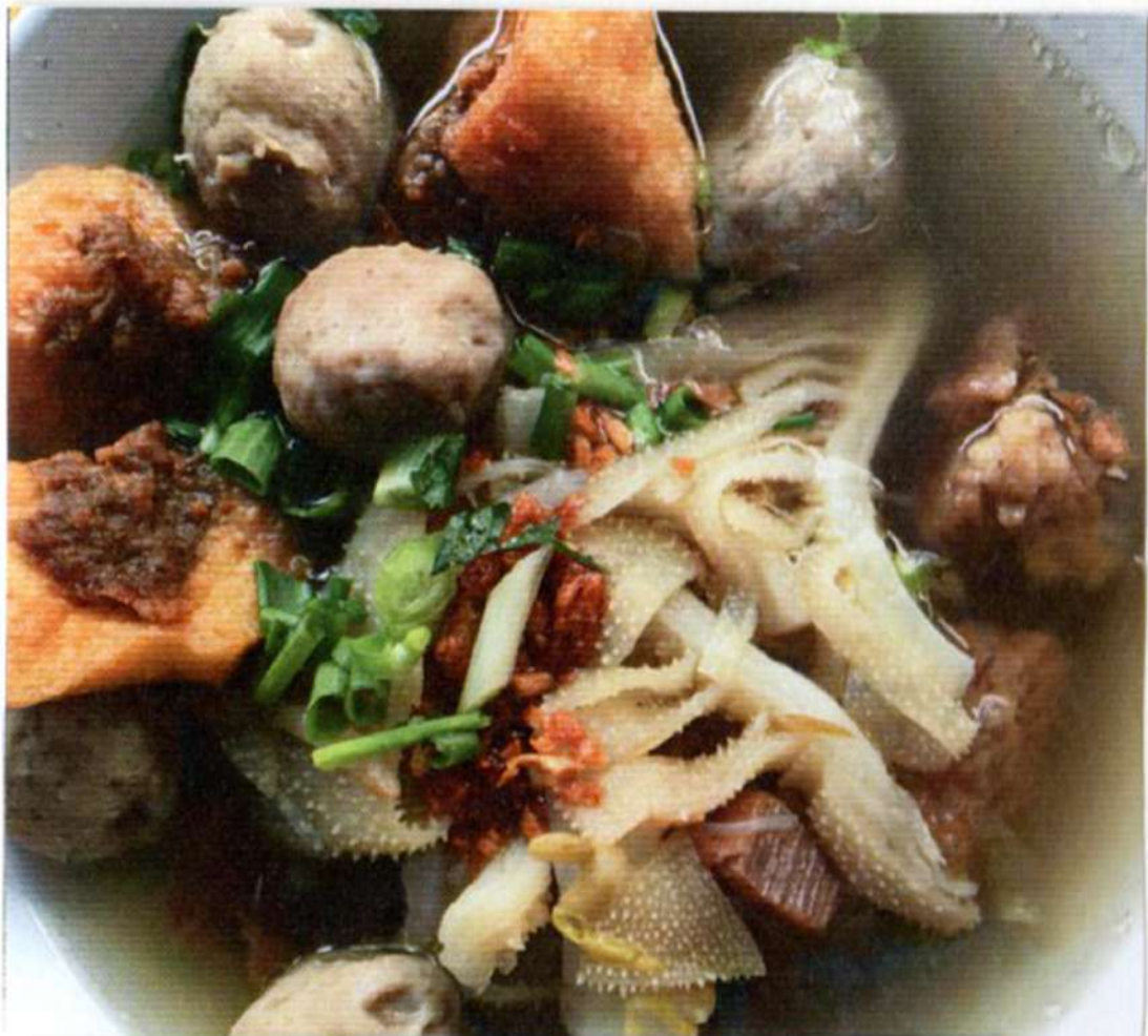
Bakso 21 Bakso khas singkawang yang 'diramaikan' oleh potongan daging dan babat sapi empuk.