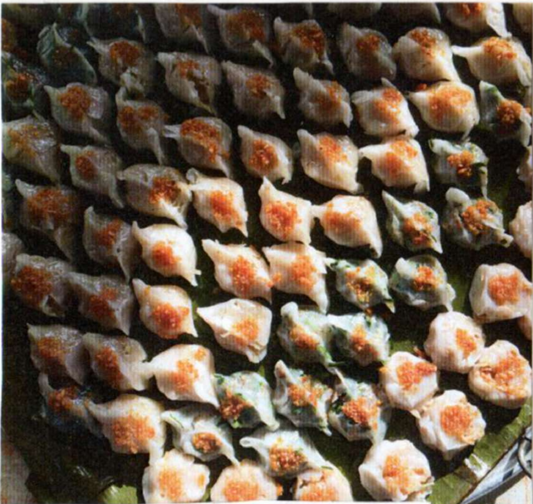
Choipan Sakkok dengan pilihan isi bengkuang, daun kucai atau rebung.