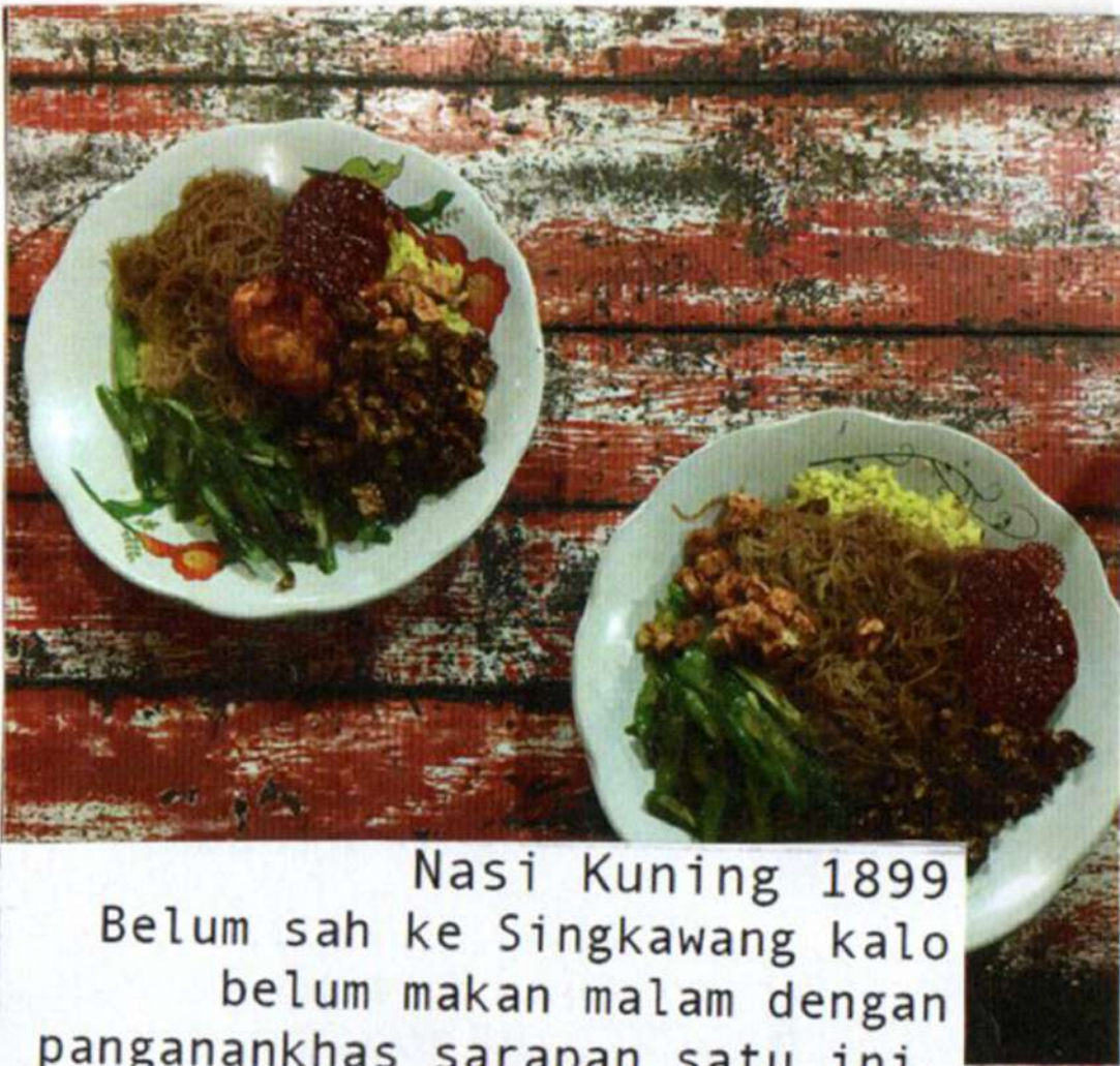
Nasi Kuning 1899 Belum sah ke Singkawang kalo belum makan malam dengan pangan khas sarapan satu ini.