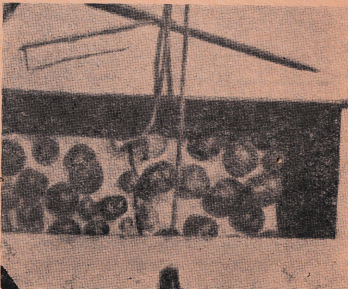
BENDA 2 PADAT JANG MENGAN- DUNG BESI DAN MANGAN JANG DIPEROLEH DA- RI TJELAH CHAGOS

Ekspedisi kami dapat mentjat ber-bagai 2 daerah jang punja kemungkinan untuk — usaha perikanan jang madju; dan ini, tentunja, sangat penting untuk semaksimum-maksimumnja mempergunakan samudera guna tudjuan 2 ekonomi.