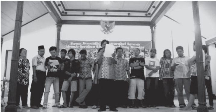
Gambar 19. Delegasi dari 12 Komunitas Petani FKMA sedang membacakan Pernyataan Sikap di Kongres Petani Otonom II

berjejaring bukan hanya pada persoalan perlawanan akan tetapi juga bagaimana kita membangun sebuah kekuatan perekonomian kerakyatan yang betul-betul kuat dan kokoh. Yang tak lepas dari bertani dan metode-metode cara bertani yang baik dan benar terutama di lahan pesisir.