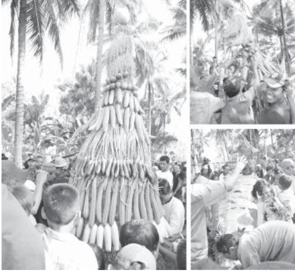
Sumber: Dokumen PPLP, 14 Febuari 2011.

Gambar 5. Pugeran merupakan upacara kebudayaan rutin yang dilakukan warga PPLP setiap tahunnya sebagai bentuk rasa sryukur mereka kepada tuhan . tumpengan dibuat dari seluruh hasil pertanian yang berada di lahan pantai.