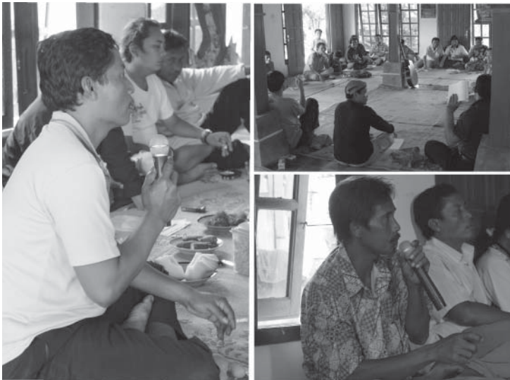
Sumber: Dokumen PPLP, 21 Desember 2011.

Gambar 6. Bertukar pendapat dan berbagi pengalaman dalam sebuah forum komunikasi antar gerakan tani sebagai penguatan gerakan.