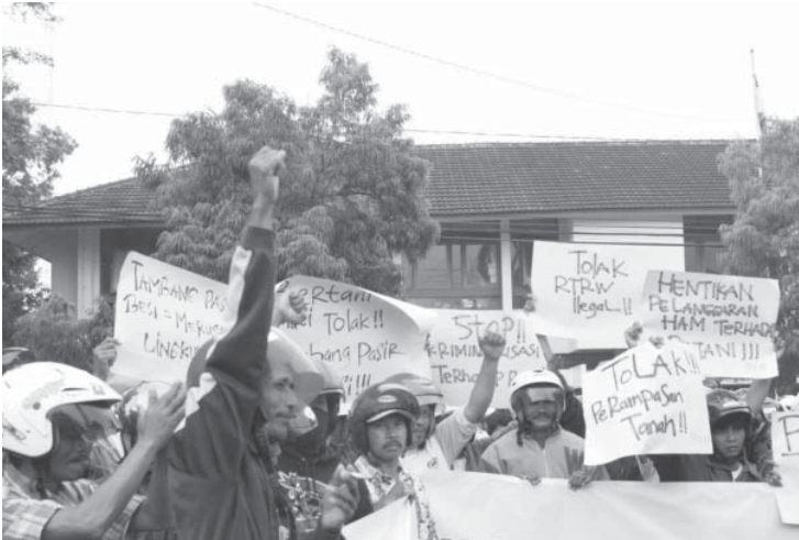
Gambar 1. Aksi warga PPLP menolak Perda tata ruang Kabupaten Kulonprogo.

Misalnya salah satu sumber mengatakan, sebab dia pernah berbincang tentang sesuatu kasus yang terjadi di pesisir Kulon Progo, yaitu kasus penambangan pasir besi yang sampai saat ini terus ditentang oleh masyarakat setempat yang akan terganggu hak dan lingkungan mereka hidup dan tinggal. Padahal bisa dikatakan orang tersebut adalah seorang agamawan dan konsen di sebuah lembaga sosial independen. Dia melakukan pembenaran atas apa yang dilakukan oleh pemerintah dan kaki tangannya, padahal dia tidak tahu situasi yang sebenarnya terjadi. Lebih buruknya lagi dia mengatakan tindakan rakyat pesisir untuk menentang penambangan itu sebuah tindakan tidak benar dan menentang agama. Ironis sekali.