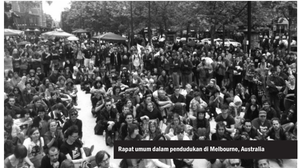
Rapat umum dalam pendudukan di Melbourne, Australia

Rapat Umum atau General Assembly adalah model yang diadopsi dalam aksi-aksi pendudukan terkini, yakni sebagai cara berdiskusi dan membuat keputusan. Rapat Umum adalah sebuah pertemuan terbuka yang horizontal, tanpa pemimpin, dan berbasis pada konsensus. Dari Rapat Umum inilah dilahirkan keputusan-keputusan yang berhubungan dengan seluruh kelompok dimana diskusi-diskusi umum dilaksanakan.