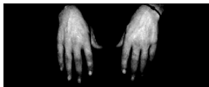
Tidak (tidak sepakat)