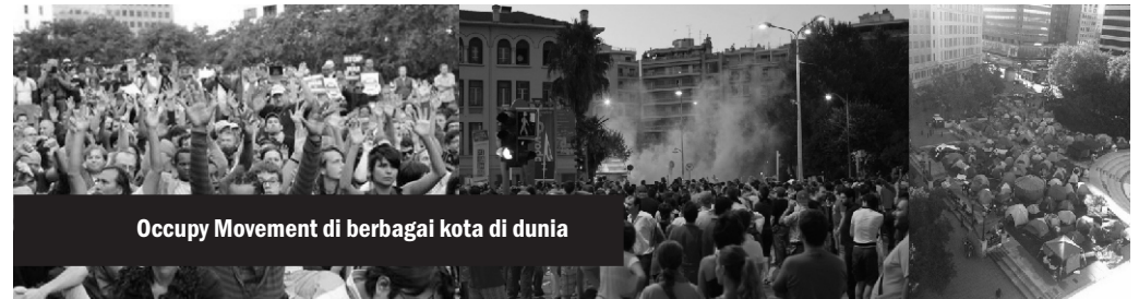
Occupy Movement di berbagai kota di dunia

Gerakan pendudukan (Occupy Movement) adalah gerakan internasional, yang diilhami oleh aksi-aksi anti-diktator di Arab dan gerakan pendudukan anti-langkah penghematan di Yunani dan Spanyol.