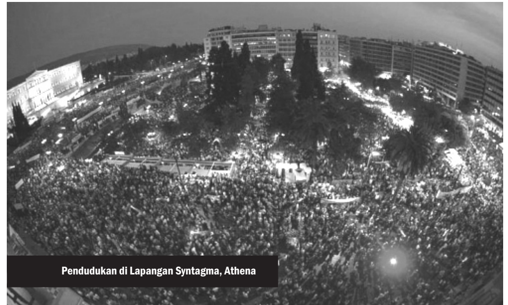
Pendudukan di Lapangan Syntagma, Athena

Dana Moneter Internasional atau IMF menuntut pemangkasan anggaran besar-besaran di semua sektor pengeluaran Yunani, yang lantas menggiring negara pada ambrohnya perekonomian dan menyebabkan rakyat menderita. Sebagai respon dan terinspirasi langsung dari #Spanish Revolution, pendudukan pun bersemi ke seluruh penjuru negeri. Demonstrasi di Lapangan Syntagma, Athena dimulai dengan 30,000 partisipan. Aksi pendudukan dan demonstrasi damai yang terbesar dalam dua bulan terakhir mencapai 200,000 partisipan.