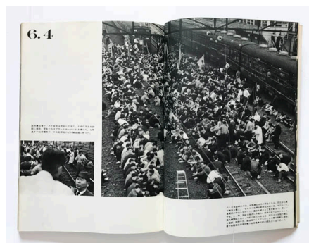
Gambar 1 – Ilustrasi Hamaya Hiroshi dari kari to kanashimi nokiroku (Record of Anger and Sadness), 1960.