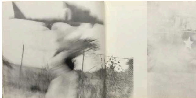
Gambar 5 - Tōmatsu Shōmei. Ilustrasi dari Okinawa, Okinawa, Okinawa, 1969.

(1969) (gambar 5). 29 Hal ini dikontraskan dengan aktivitas sehari-hari penduduk pulau, termasuk mereka yang memprotes penggunaannya. B-52 terlihat lagi dalam bentuk serial di jurnal Non (1970), sebuah kekuatan gelap yang tampak semakin besar di atas rakyat Jepang. 30 Sebuah lambang grafis dari kekuatan destruktif dari teknologi Amerika yang luar biasa, hal ini juga merujuk pada pengambilalihan kedaulatan Jepang. Dan dalam Provoke 2, pesawat tersebut tampaknya menyebar ke dalam butiran kertas, sebuah penggambaran fotografi dari senjata paling mematikan dari kekuatan konstituen.