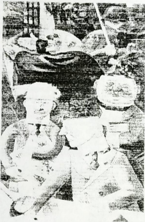
George Grosz, 1926. Satire penyangga masyarakat

Di Barat, banyak mereka yang Kanan juga berbelok mencuri inspirasi dari pemikir-pemikir anarkis. Sebuah gerakan baru berlabel 'anarko-kapitalisme' telah muncul dengan niat menderegulasikan perekonomian dan menghapuskan campur tangan pemerintah. Kendati tak sepenuhnya sukses, Perdana Menteri Margaret Thatcher di Inggris mencoba 'menarik mundur batas peran Negara', sementara di Amerika, Presiden Ronald Reagan kepingin dikenang dengan prinsip-prinsip 'mengembalikan pemerintahan rakyat'. Partai Liberal yang mendorong pikiran ini lebih jauh, muncul sebagai partai ketiga terbesar di Amerika pada 1980-an.