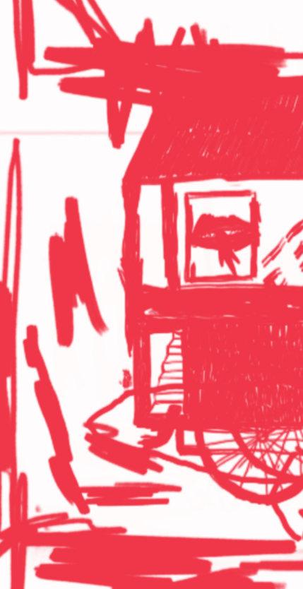
Head licking the bathtub | 2020 Oleh : Junieawan Bagaskara

Karantina diri secara umum bisa dia tindakan individu mengurung diri d tidak bertemu langsung (interaksi) d kurun waktu tertentu. Tapi bagaim seyogiannya tetap membutuhkan in maupun dengan hal-hal yang lainny