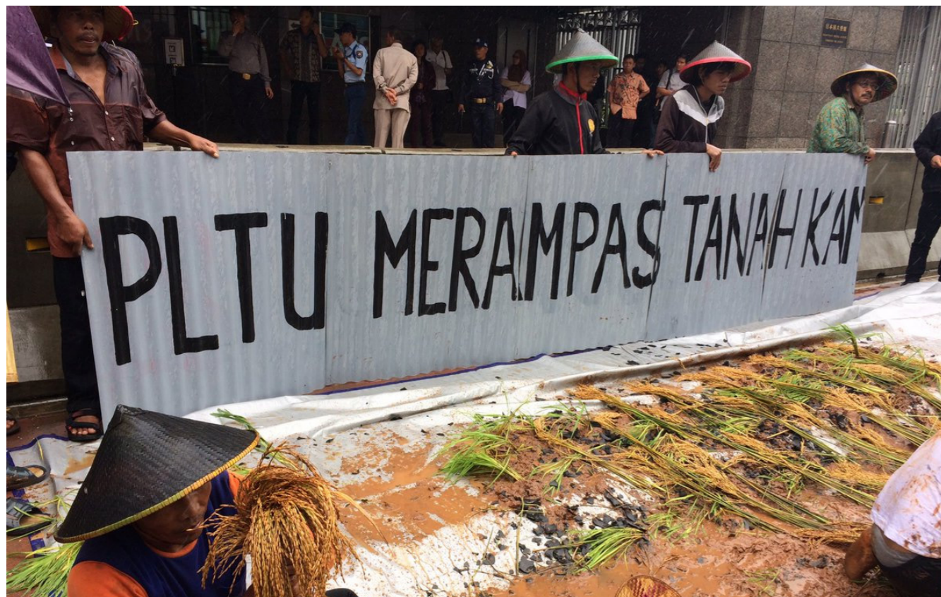
Aksi protes warga Batang menolak PLTU di depan Kedubes Jepang di Jakarta.

Memandang kondisi di atas, kita perlu menengok warisan penting dari Amartya Sen, mengenai bencana kelaparan sebagai sebuah produk dari monopoli pangan. Pemenang Nobel Ekonomi asal India ini dahulu telah melakukan kritik terhadap pendekatan Malthusian yang menyederhanakan masalah dengan memandang bahwa bencana kelaparan timbul akibat berkurangnya ketersediaan pangan.[20] Sen justru melihat bahwa bencana kelaparan justru tidak disebabkan oleh macetnya mata rantai suplai pangan. Sebaliknya, yang terjadi adalah runtuhnya