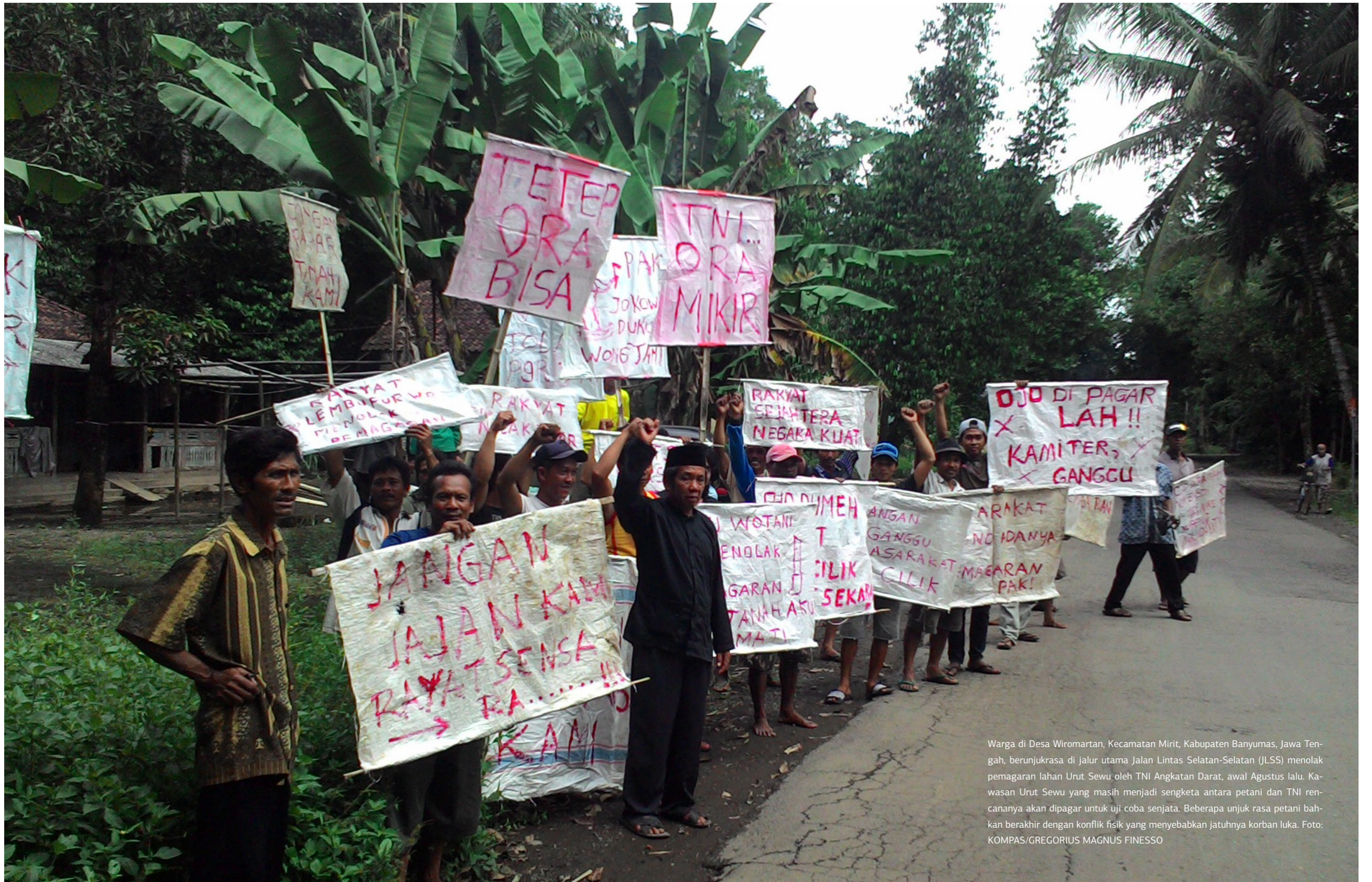
Warga di Desa Wiromartan, Kecamatan Mirit, Kabupaten Banyumas, Jawa Tengah, berunjukrasa di jalur utama Jalan Lintas Selatan-Selatan (JLSS) menolak pemagaran lahan Urut Sewu oleh TNI Angkatan Darat, awal Agustus lalu. Kawasan Urut Sewu yang masih menjadi sengketa antara petani dan TNI rencananya akan dipagar untuk uji coba senjata. Beberapa unjuk rasa petani bahkan berakhir dengan konflik fisik yang menyebabkan jatuhnya korban luka.