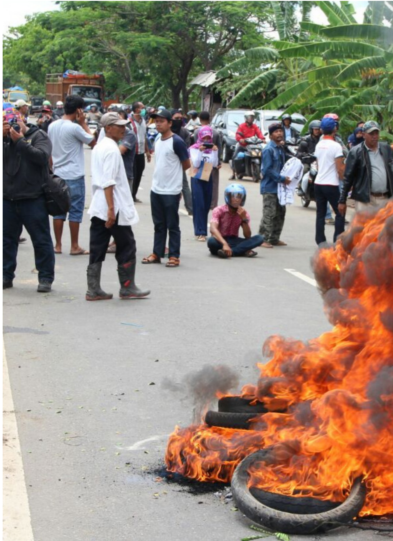
Warga turun ke Jalur Pantura Cirebon, Jabar, memprotes pendirian PLTU di Desa Kanci, Astanajapura, Senin (10/10/2016).