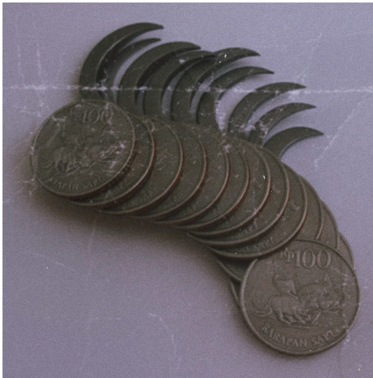
(Nina Ricci, Seri Gestur, 100 Luka, foto dok: Pong, 2003)