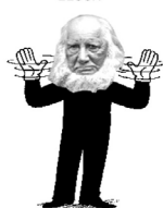
WRAP IT UP