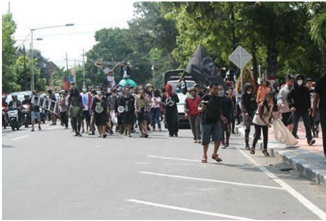
Aksi Hari Bumi, mencabut paku di pohon, memcopot spanduk dan membersihkan sampah kota.