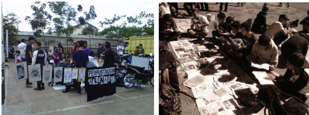
Gambar : Aktivitas Perpustakaan Jalanan

“Untuk perpustakaan jalanan, awalnya kami melihat banyaknya buku yang menumpuk di rak buku kami cukup banyak dan terasa 'mubazhir' jika hanya jadi koleksi pribadi. Kami pikir akan menarik jika kami turun ke jalan meski hanya seminggu sekali, membawa buku-buku, zine, atau koleksi bacaan lain yg kami punya, dan membiarkan orang-orang bebas membaca bacaan-bacaan tersebut. Sekarang, setiap malam minggu, jika tidak ada aral melintang kami rutin menggelar perpustakaan jalanan ini. Kami juga mengusahakan adanya lapak gratis dan kompor publik per bulannya di lokasi yang sama. Cukup banyak orang berkumpul hingga kami bisa mengenal lebih banyak orang dan membangun jejaring komunitas yang lebih luas”