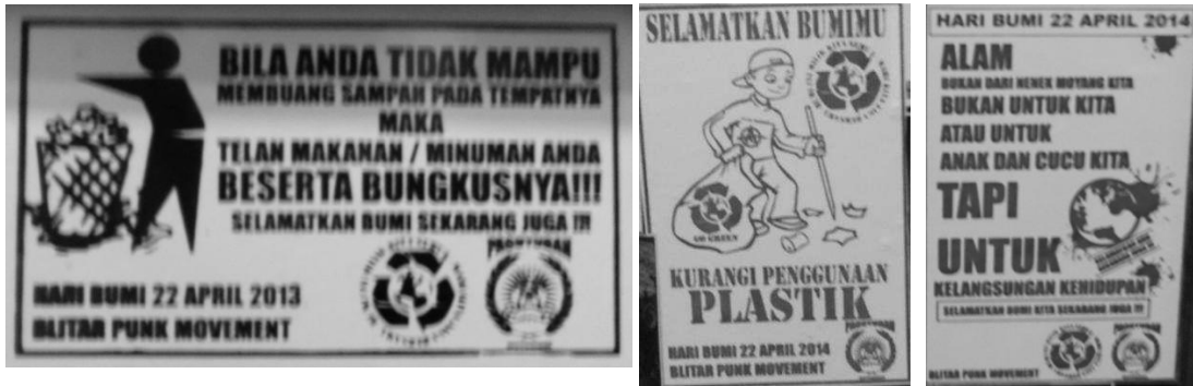
Gambar : Beberapa Poster Kampanye Blitar Punk

Simbah menganggap gerakan Punk di Blitar sudah cukup besar dan bagus karena walaupun tidak disediakan fasilitas apa-apa partisipan aksi selalu banyak yang datang, ini dilakukan karena Simbah berusaha agar para Punkers bisa melakukan tindakan nyata yang bermanfaat, bukan hanya sekedar koar-koar saja.