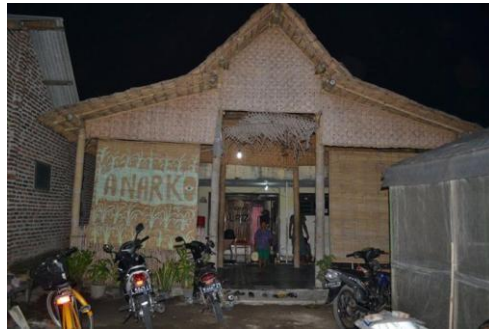
Gambar : Sanggar Al-Faz sebagai solidaritas perjuangan korban Lumpur Lapindo

di Jogja yang bersolidaritas dalam perjuangan petani pesisir Kulonporogo untuk menolak rencana pembangunan proyek tambang pasir besi di Kulonprogo, Kolektif dan individu di daerah Pegunungan Kendheng dalam menolak rencana pembangunan pabrik semen di Rembang, dan Solidaritas dalam perjuangan korban lumpur lapindo.