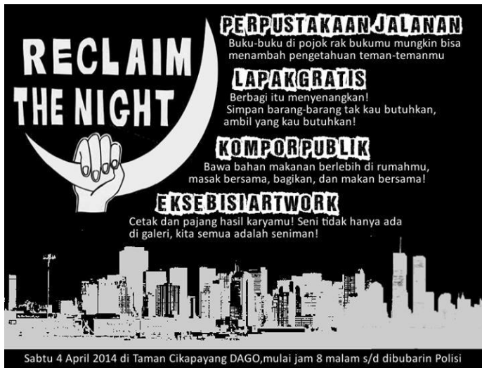
Poster Perpustakaan Jalanan.