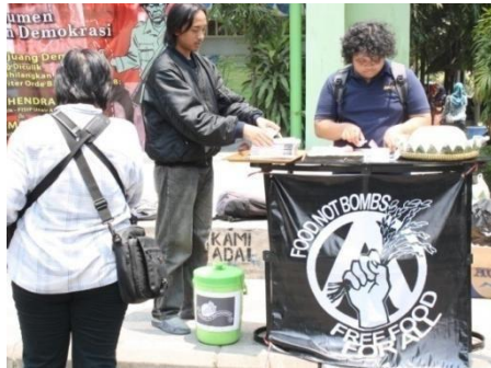
Gambar : Foto aksi Tabling grup FNB pada Peringatan 14 Tahun Penculikan Aktivis 97-98 di Tandon Herman-Bimo Kampus B Unair.

kemiskinan dan penghancuran ekologi/ lingkungan akibat perang. Di tengah miliaran orang menderita kelaparan setiap harinya, negara malah menghabiskan uangnya untuk pembiayaan perang (Untuk lebih lanjutnya bisa dilihat di situs FNB internasional www.foodnotbombs.net ).