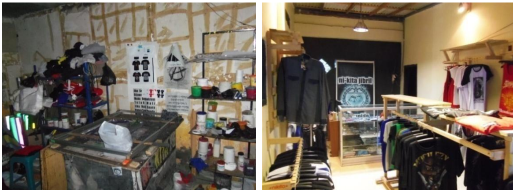
Gambar : Ruang Produksi dan Ruang Distribusi Ni-Kita Jibril Komunike

Ni-Kita Jibril Komunike sendiri sudah mempunyai basic ekonomi yang cukup bagus, disitu terdapat rumah produksi percetakan, sablon dan desain grafis. mulai dari produksi sampai distribusi sistem kerjanya mereka buat dan sepakati sendiri. Selain itu disana mereka juga membuat usaha cucian mobil dan motor, di halaman belakang pun mereka pakai untuk ternak ikan.