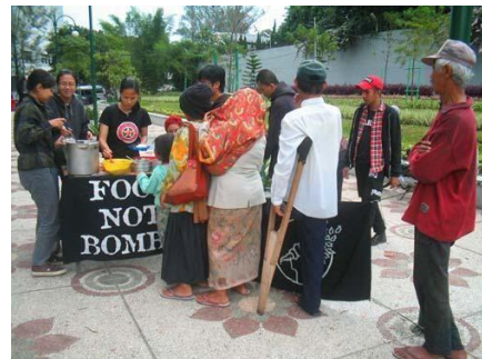
Gambar : Aktivitas Food Not Bombs