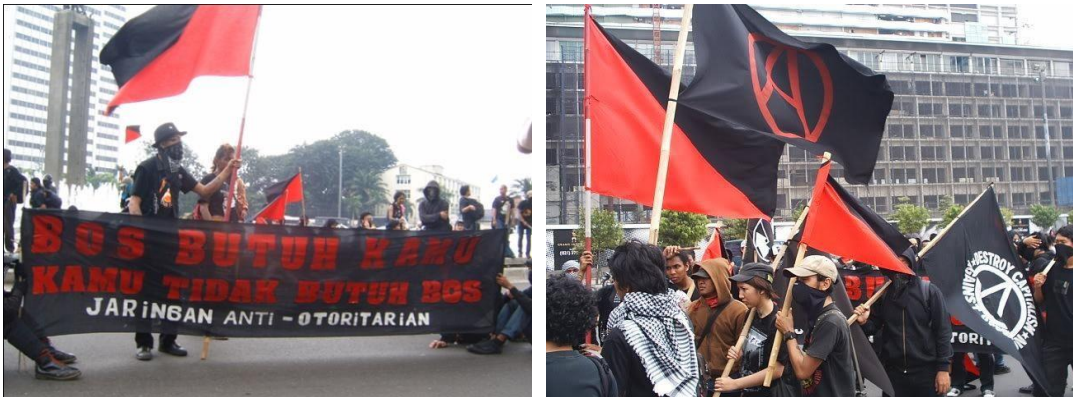
Gambar: Aksi long march JAO (Jaringan Anti Otoritarian) pada Mayday 2007.

2007. Kolektif yang terlibat adalah Affinitas (Yogyakarta), Jaringan Otonomis (Jakarta), Apokalips (Bandung), dan Jaringan Autonomus Kota (Salatiga). Selain dari kolektif, individu-individu dari berbagai kota seperti Bali dan Semarang juga berpartisipasi, serta kolektif Punk di Jakarta.