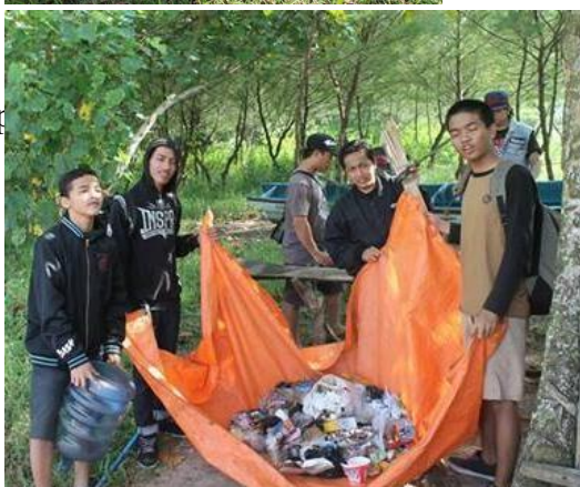
Aksi penghijauan dan bersih-bersih