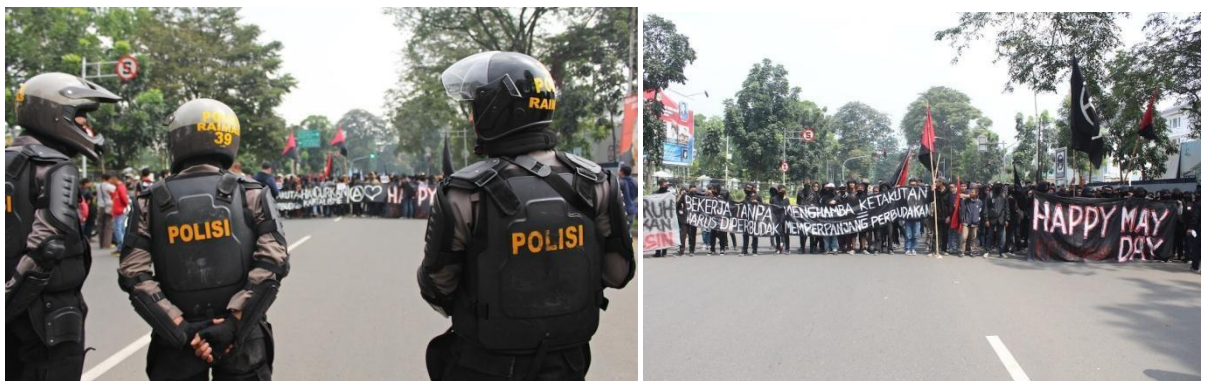
Aksi Mayday dengan menggunakan taktik 'Black Block' dan dihalau oleh barikade Polisi.