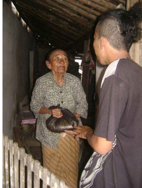
Membagikan sembako pada masyarakat yang membutuhkan