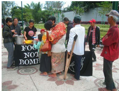
Gambar : Aktivitas FNB Bandung

“FNB di Bandung sudah berkegiatan sejak 2004..kalau tidak salah sih, dan memutuskan untuk bubar pada tahun 2010. Setiap seminggu sekali rutin membagikan makanan gratis. Bahan makanan kami dapatkan dari supplier sayuran untuk supermarket dan kami masak bersama di rumah salah satu volunteer kami. Alasan bubarnya karena para volunteer merasa FNB ini tidak dibutuhkan lagi, salah satu indikatornya adalah semakin berkurangnya pelanggan makan gratis kami”.