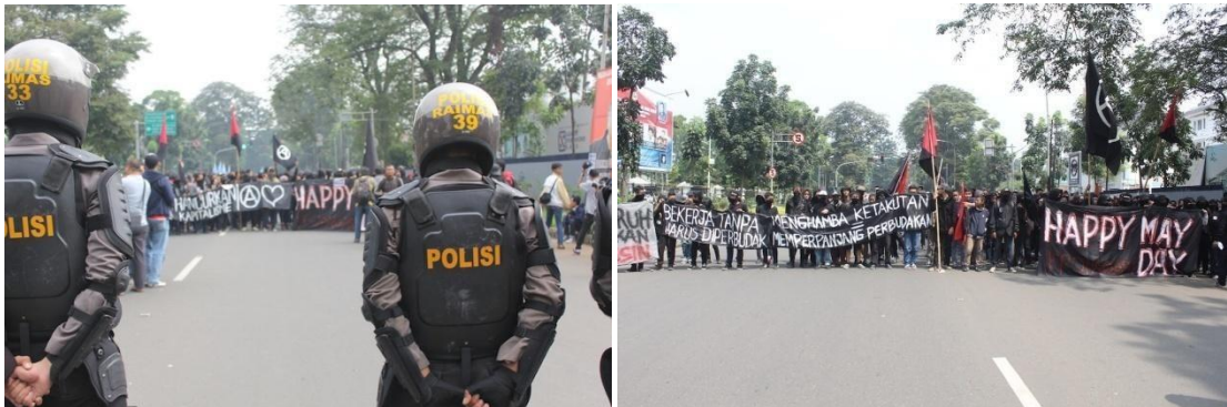
Gambar : Aksi Mayday ‘Black Block’ Bandung.

march menuju gedung sate dengan membawa beberapa atribut aksi. Namun kelompok yang oleh beberapa media disebut sebagai ‘Kelompok hitam tak bernama’ ini dibubarkan oleh polisi sebelum sampai di gedung sate untuk bergabung dengan massa aksi lain.