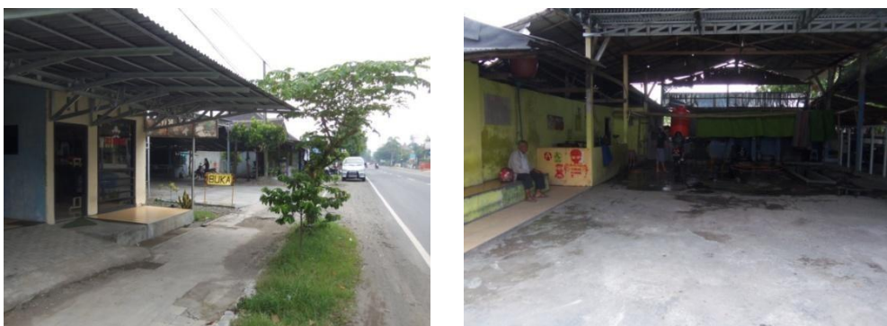
Gambar : Lokasi Basecamp Ni-Kita Jibril dan Usaha Cucian Mobil/Motor