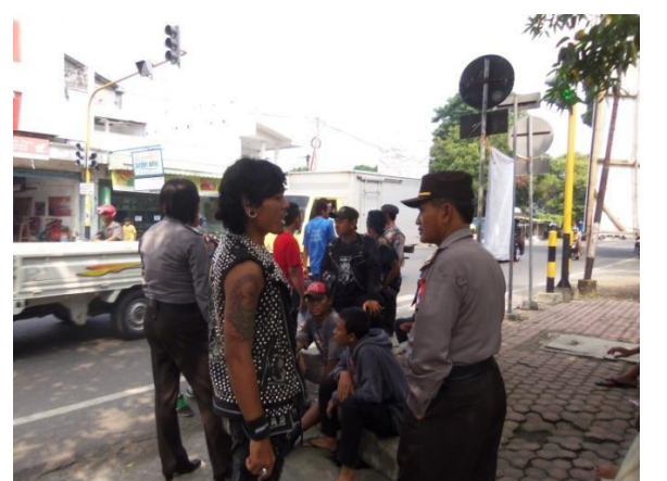
Aksi Mayday, Membagikan selebaran propaganda Mayday dan tabling FNB