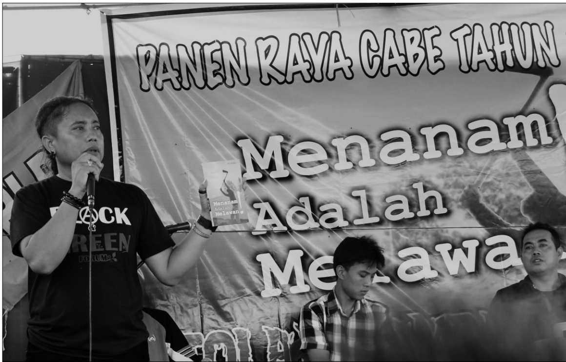
■ Launching buku Menanam adalah Melawan yang dilakukan di Desa Garongan bersamaan dengan panen raya cabe, Juni tahun 2013.