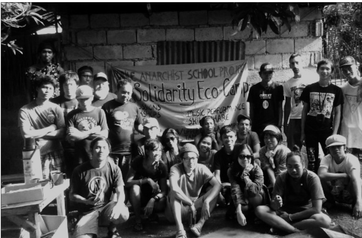
■ Foto bersama setelah diskusi internal Local Autonomous Network di sebuah kebun yang dikelola secara kolektif di Philipina. Membahas gerakan anti otoritarian di tingkatan lokal masing-masing wilayah dan bagaimana membangun jaringan lintas negara dan upaya-upaya saling mendukung yang bisa dilakukan, Maret tahun 2013.

Ditemani seorang penerjemah, ia mempresentasikan perlawanan PPLP-KP dan berbagai pengalaman komunitas akar rumput di Indonesia dalam menghadapi konflik agraria dan kapitalisme global, khususnya yang terhimpun dalam FKMA.