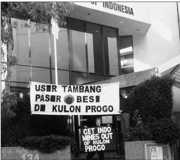
Aksi solidaritas Tolak Tambang Besi dari kawan-kawan jaringan PPLP-KP di Australia di depan gedung Kedutaan Indonesia untuk Australia.