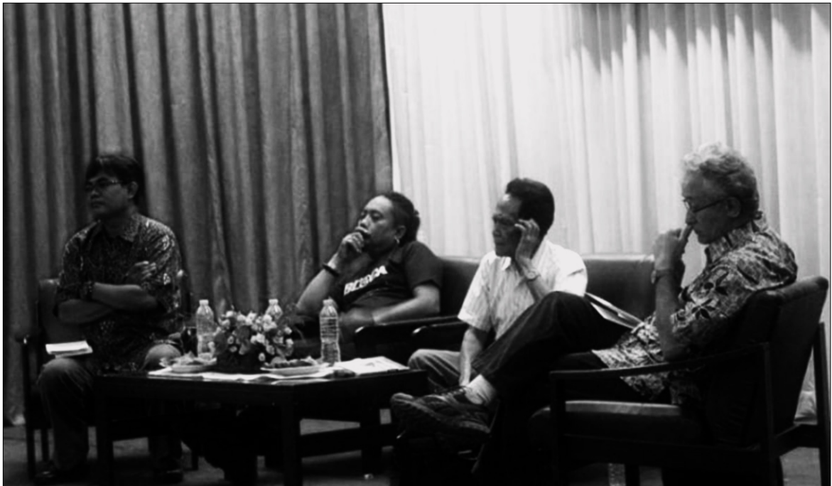
■ Bedah buku Menanam adalah Melawan di IPB, 12 November 2013.