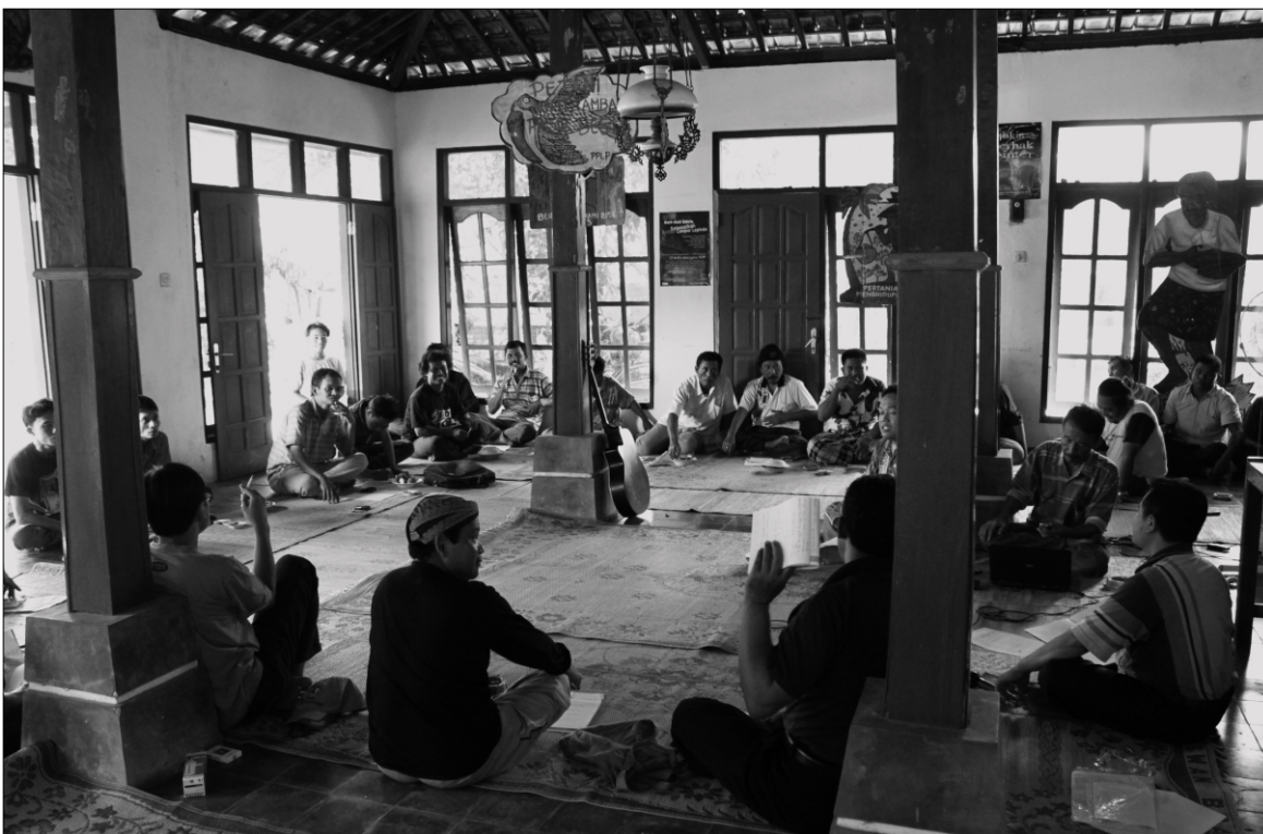
■ Pertemuan FKMA (Forum Komunikasi Masyarakat Agraris) di Kulon Progo yang dihadiri sepuluh komunitas akar rumput, antara lain dari Pati, Lumajang, Kebumen, Cilacap, Kulon Progo, Blitar, Banten, Tasikmalaya, Ciamis, Cilacap, dan korban lumpur Lapindo Sidoarjo. 20–22 Desember 2011.

“Wong orang-orang ini hidupnya di jalanan, pernah masuk penjara, kerjanya demo, suka melawan, datang ke wilayah-wilayah konflik, dikejar-kejar polisi, gak tau masa depannya mereka