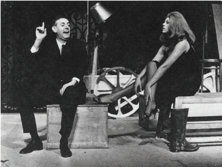
Dario Fo dan Franca Rame dalam Settimo: ruba un po' meno , 1964.