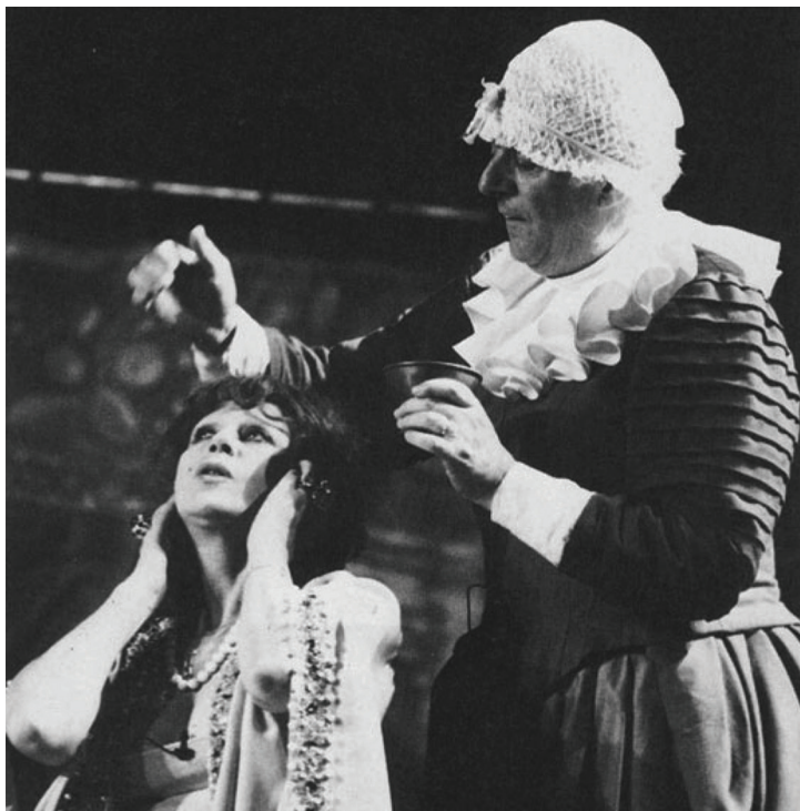
Franca Rame dan Dario Fo dalam Quasi per caso una donna: Elisabetta , 1984.

50. Il ratto della Francesca ( Kidnapping Francesca ; versi adaptasi: Abducting Diana ); dua babak; pentas perdana di Teatro Sloveno, Trieste, 1986; berkisah tentang penculikan Francesca Bollini de Rill, perempuan bankir kaya. Francesca diculik oleh beberapa orang yang menyamar sebagai petugas pemadam kebakaran, namun segera saja penculikan ini men-