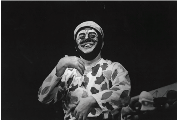
Dario Fo bermain dalam Hellequin, Harlekin, Arlecchino (1985), dengan menggunakan tata rias dan busana khas commedia dell'arte .

Fo mencapai 130 kali pertunjukan setiap tahunnya. Sambil bersila atau duduk di lantai, para penonton itu terkesima oleh semua lawakan kocak yang diperagakan Fo. Seperti dalam teater rakyat umumnya, di mana antara publik, pemain dan panggung tak ada jarak.