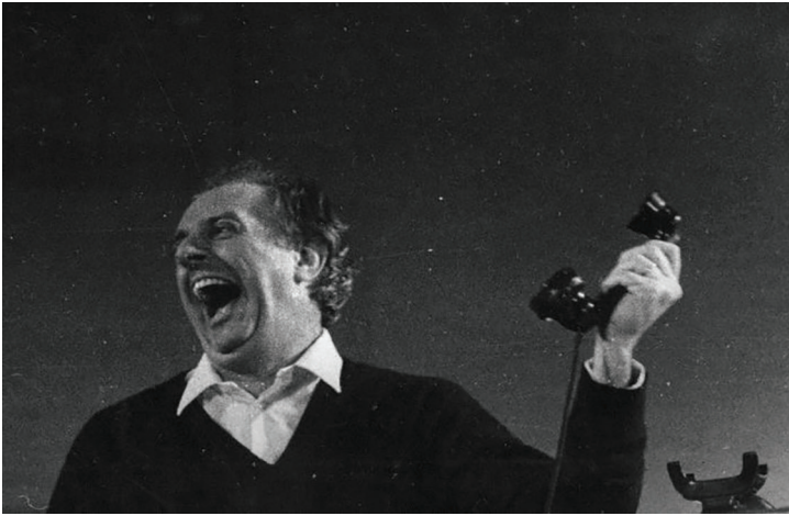
Dario Fo memerankan tokoh Orang Gila dalam Anarkis Itu Mati Kebetulan .

sebanyak 71 kali didalangi oleh kalangan sayap kanan untuk mengembuskan rasa curiga dan menciptakan rasa benci masyarakat terhadap kalangan kiri. Teater La Comune mencoba hadir dalam situasi tak menentu itu sebagai informasi tandingan atas kabar bohong yang tersebar di media massa yang merugikan sayap kiri.