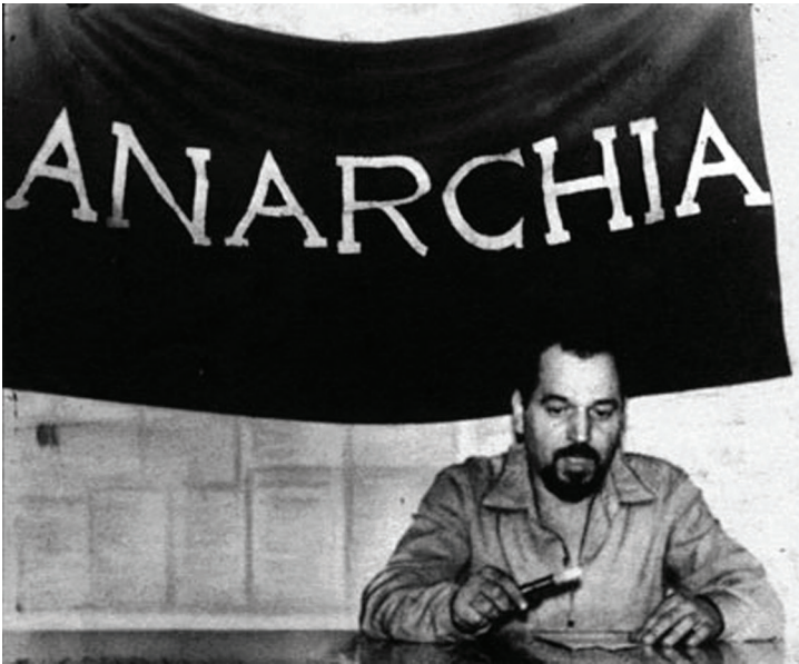
Giuseppe Pinelli dalam sebuah pertemuan kaum anarkis Italia di Milan, 1967.

perkara Pinelli. Kami membuat draf pertama berupa lakon komedi. Sebenarnya lebih tepatnya sebuah dagelan: begitu grotesque dan menyedihkan. Semua tahap penyidikan berkontradiksi dengan pernyataan resmi. Kami diperingatkan bahwa lakon tersebut bakal berisiko digugat, diintimidasi, dibawa ke pengadilan. Tapi kami putuskan bahwa lebih baik mencoba dulu, sebab merupakan kewajiban kami sebagai militan politik harus bertindak dengan tegas. Yang penting adalah bertindak cepat dan berbuat selagi situasi masih panas.