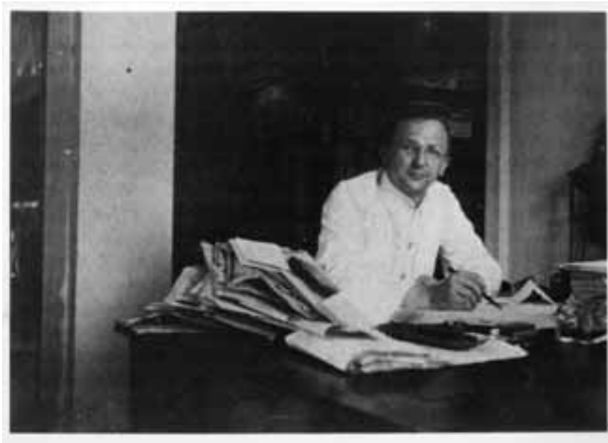
Henk Sneevliet in zijn werkkamer te Semarang tussen 1913 en 1920.

Internationaal Instituut voor Sociale Geschiedenis, Amsterdam