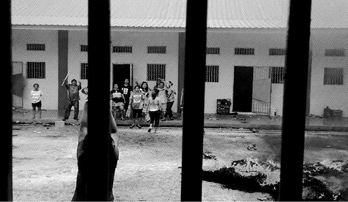
TAHANAN DI LAPAS PEREMPUAN PALANGKARAYA MEMBAKAR KASUR DI HALAMAN, 2019

besar tahanan menjalani hukuman yang singkat, angka pergantian tahanan perempuan tinggi sekali. Apalagi jika mempertimbangkan kenyataan bahwa sejak 2018 hingga 2022, jumlah tahanan perempuan kurang lebih selalu di angka 13 ribu orang. Tahanan perempuan keluar dan masuk penjara di jumlah yang relatif stabil dan menjalani hukuman dalam waktu singkat, membuat tahanan perempuan, mungkin, lebih enggan untuk melakukan upaya perlawanan yang beresiko. Masa hukuman yang singkat juga membuat solidaritas tahanan lebih lemah.