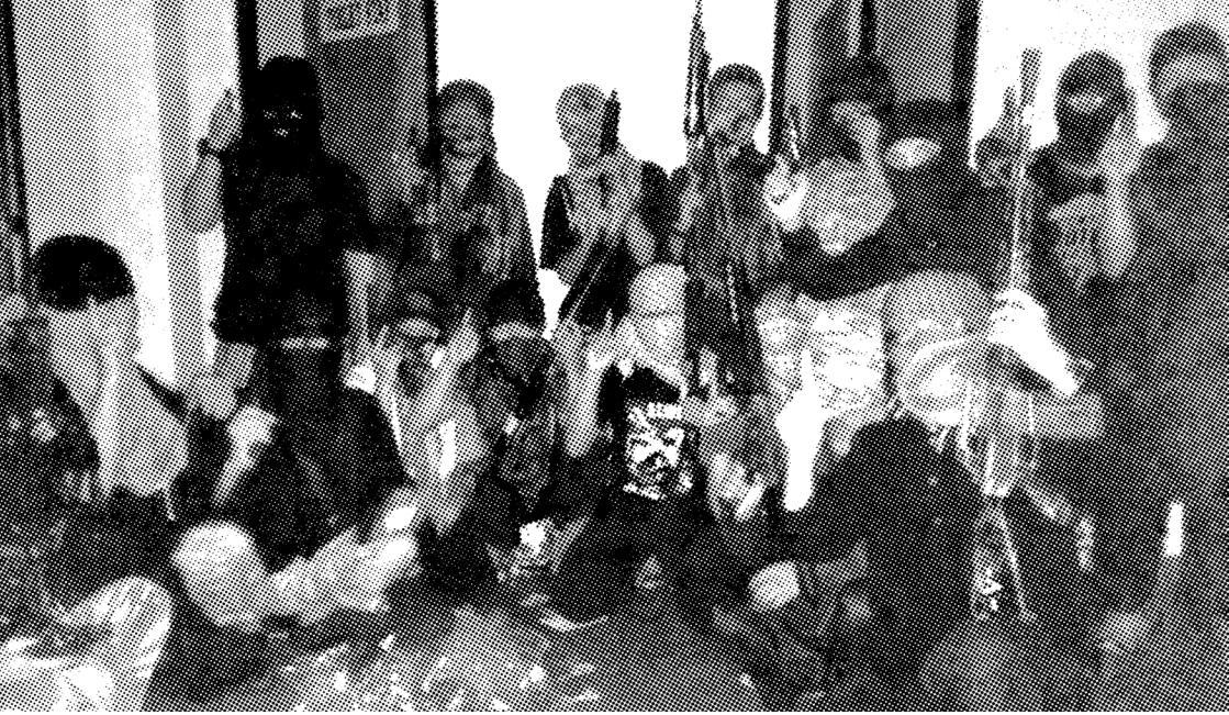
TAHANAN TERORIS DI RUTAN MAKO BRIMOB BERFOTO SETELAH MERAMPAS SENJATA PETUGAS PASCA KERUSUHAN AKIBAT MAKANAN BESUK DARI KELUARGA TIDAK DIBERIKAN, PADA 2018.