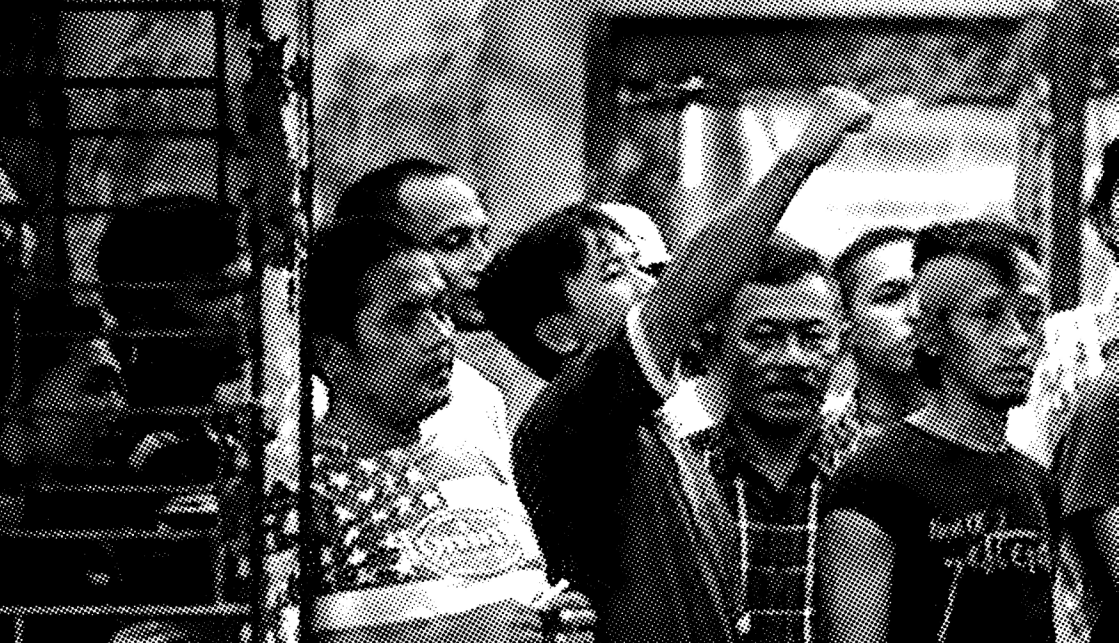
TAHANAN LAPAS TANJUNG GUSTA MEDAN SAAT KERUSUHAN YANG MEMBUAT 212 TAHANAN MELARIKAN DIRI PADA 2013.

Semua dimulai oleh aksi serentak mahasiswa Papua yang mengecam penandatanganan Kesepakatan New York antara Pemerintah Indonesia dan Belanda pada 15 Agustus 1962 tentang pemindahan kekuasaan atas Papua barat dari Belanda ke Indonesia. Para pendukung referendum memandang bahwa kesepakatan ini tidak sah karena tidak melibatkan elemen masyarakat Papua, dan bahwa Penentuan Pendapat Rakyat (Pepera) yang diadakan pada 1969, proses dan hasilnya dimanipulasi agar Papua Barat diintegrasikan secara paksa pada Indonesia. Polisi dan ormas anti-separatisme melakukan serangkaian kekerasan rasial sebagai respon atas aksi para mahasiswa Papua, menyebut mereka dengan “monyet”, hingga mengevakuasi paksa mahasiswa dari asramanya. Walikota Malang bahkan menyatakan bahwa para mahasiswa Papua dapat dipulangkan ke daerah asalnya.