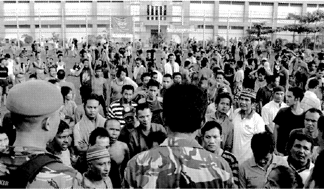
TAHANAN LAPAS NARKOBA HINAI LANGKAT MENUNTUT AGAR KEPALA LAPAS DIBERHENTIKAN, PADA 2019.