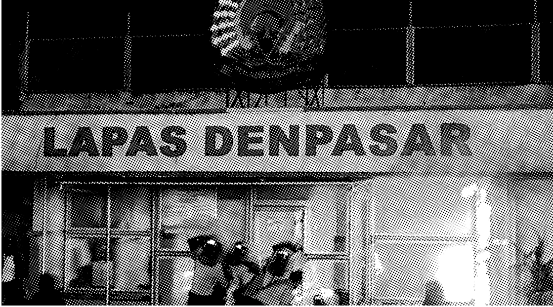
POLISI DI DEPAN LAPAS KEROBOKAN DENPASAR YANG TERBAKAR, 2012.

demonstran mengepung kendaraan polisi dan mencegahnya. Willem van Spronsen, seorang anarkis dan anti-fasis, pada Juli 2019 juga menyerang pusat penahanan imigran (ICE) di Tacoma, Washington. Spronsen yang dilaporkan membawa ransel dan suar, ditembak mati oleh polisi karena diduga hendak meledakkan tangki gas propana di fasilitas tersebut. Dalam komunike yang ia tulis sebelum melancarkan serangannya, Spronsen menghasut bahwa “sudah saatnya untuk mengambil tindakan melawan kekuatan jahat”, serta menyerang “kamp penahanan/konsentrasi yang ditujukan demi mencari profit melimpah.”