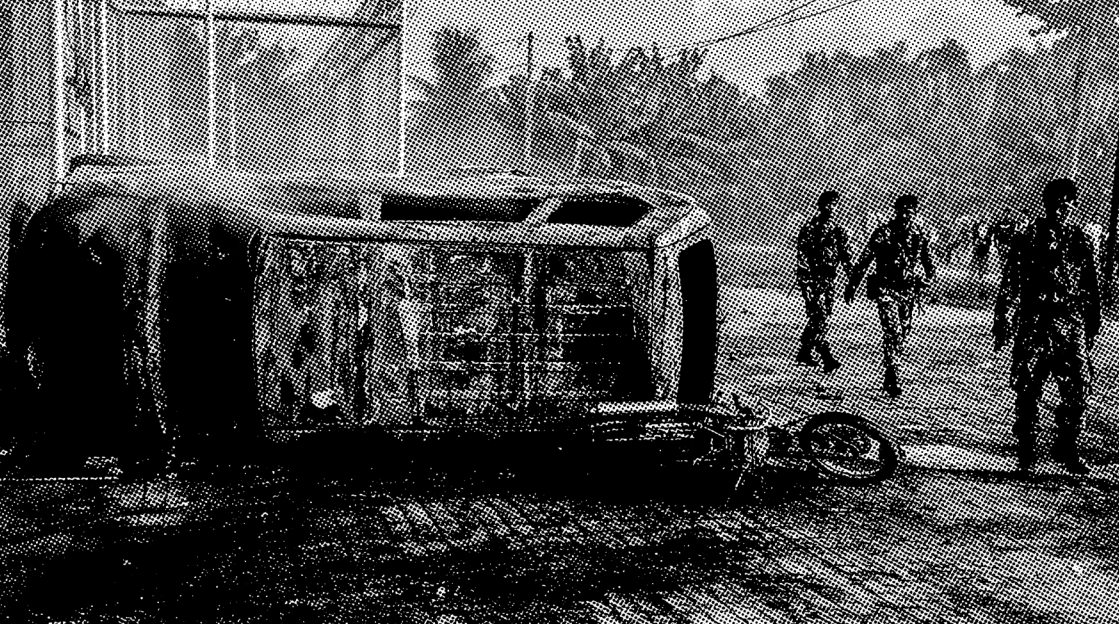
ANGGOTA TNI DI DEPAN LAPAS NARKOBA HINAI, LANGKAT, SETELAH KERUSUHAN DAN PELARIAN MASSAL 170 TAHANAN PADA 2019

diri, karena walau dimulai dari penolakan pemindahan tahanan, pemberontakan bulan Januari tidak berujung pada tuntutan apapun.