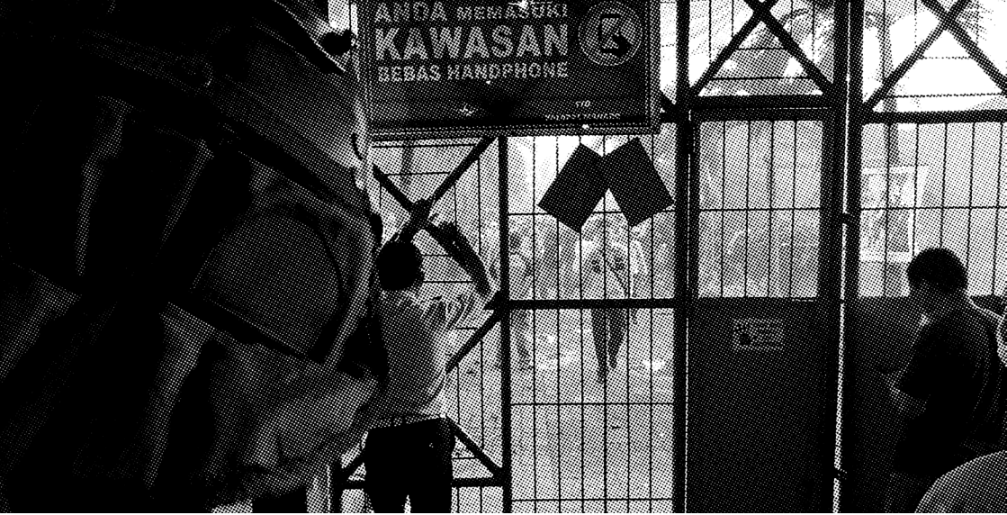
KERUSUHAN DI LAPAS TUMINTING MANADO PADA 2020.