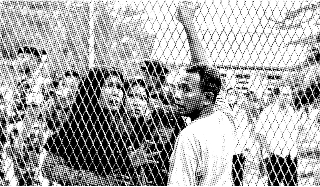
SALAH SEORANG TAHANAN LAPAS NARKOBA HINAI LANGKAT BERJUMPA DENGAN KELUARGA SETELAH KERUSUHAN, PADA 2019.