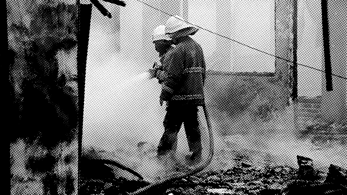
PETUGAS MEMADAMKAN API YANG MENGHANGUSKAN LAPAS BANCEUY, BANDUNG, PADA 2016.

Aceh akan jadi yang pertama dibakar. Tapi saya juga tidak bisa menjawab mengapa pemberontakan di Papua jauh lebih sedikit, padahal ini adalah titik pemberontakan separatis lain di Indonesia. Bisa jadi, polisi dan militer kita lebih suka mengeksekusi mati orang Papua ketimbang memenjarakannya, atau bahwa orang Papua lebih memilih mati ketimbang dipenjarakan penjajahnya. Yang kita ketahui, jumlah tahanan di Papua memang sedikit. Memang, semakin ke timur, semakin jarang terjadi kerusuhan penjara.