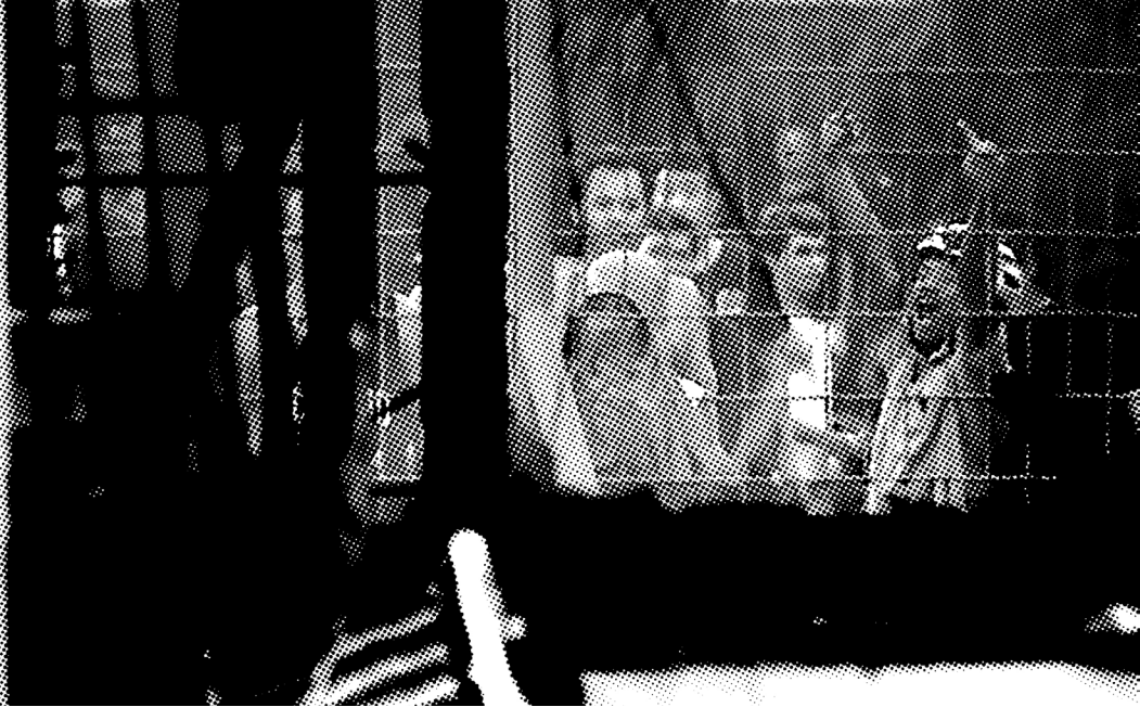
SEORANG TAHANAN MENGACUNGKAN JARI TENGAH SAAT KERUSUHAN DI LAPAS BANCEUY, BANDUNG PADA 2016.