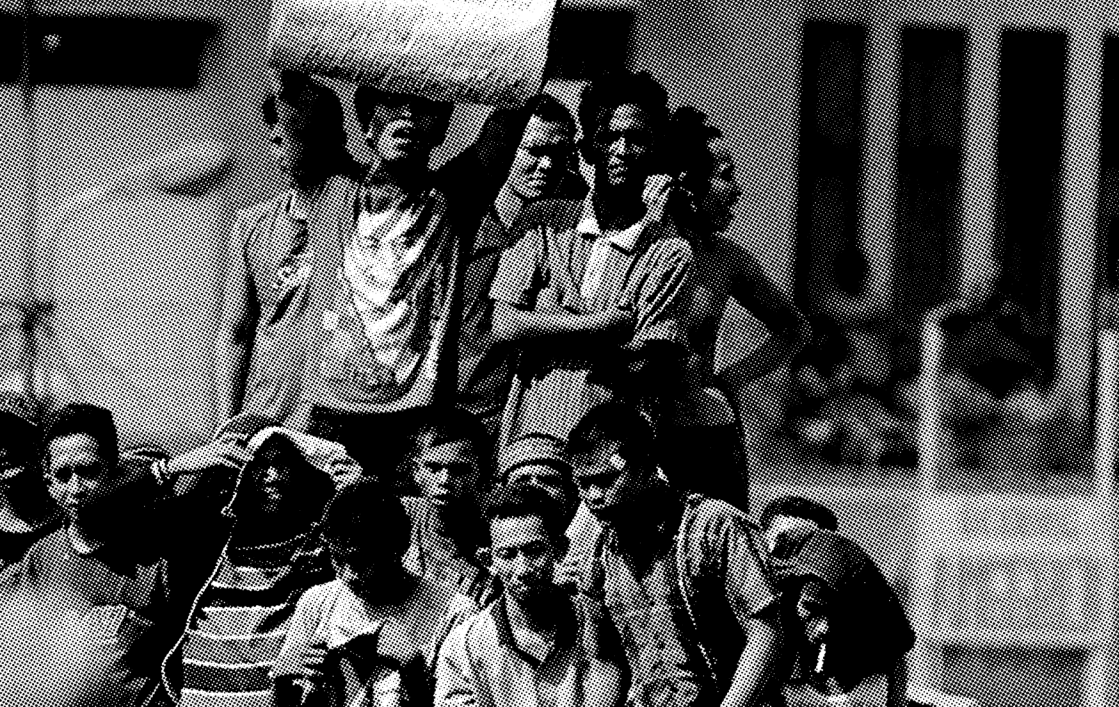
TAHANAN MEMBAWA POSTER KETIKA MENGGELAR UNJUK RASA PASCA TERJADINYA KERUSUHAN DI LAPANGAN LAPAS TANJUNG GUSTA, MEDAN, 2013