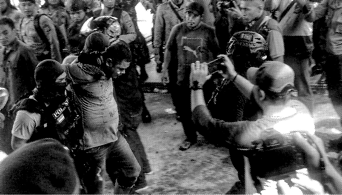
POLISI MENGAMANKAN TAHANAN LAPAS BANDA ACEH SETELAH KERUSAHAN YANG MEMBAKAR HABIS PENJARA PADA 2018.