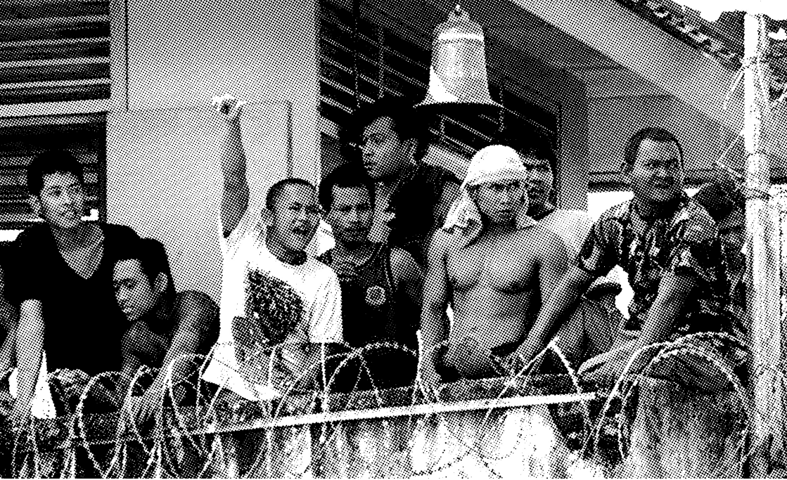
PARA TAHANAN SEMPAT MENGUASAI LAPAS KEROBOKAN, DENPASAR, 2012, MENAIKI MENARA PENGAWAS.

“Roh Tuhan Allah ada padaku, oleh karena Tuhan telah mengurapi aku; Ia telah mengutus aku untuk menyampaikan kabar baik kepada orang-orang sengsara, dan merawat orang-orang yang remuk hati, untuk memberitakan pembebasan kepada orang-orang tawanan, dan kepada orang-orang yang terkurung kelepasan dari penjara, untuk memberitakan tahun rahmat Tuhan dan hari pembalasan Allah kita, untuk menghibur semua orang berkabung.”