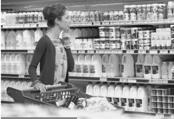
hanya ada satu kebebasan dalam Demokrasi Penaklan, kebebasan untuk memilih apa yang disodorkan

Tak bisa dipungkiri kericuhan, yang mengambil bentuk mulai dari pengerahan (mobilisasi) massa besar-besaran, protes dan perselisihan hasil pilkadal,