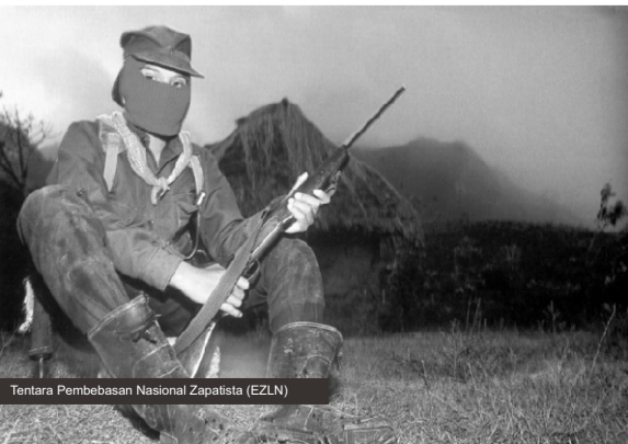
Tentara Pembebasan Nasional Zapatista (EZLN)

Consulta yang memutuskan bahwa serangan militer tahun 1994 dijalankan, setahun sebelum Marcos dan para komandan militer menganggap diri mereka siap secara militer. Consulta yang memutuskan Zapatista masuk ke meja perundingan dengan pemerintah, dan menerima perjanjian San Andres. Kemudian, Consulta juga memutuskan untuk menghentikan pembicaraan hingga pemerintah melaksanakan hal-hal yang disepakati.