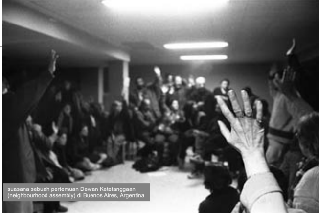
suasana sebuah pertemuan Dewan Ketetanggaaan (neighbourhood assembly) di Buenos Aires, Argentina

Secara luas, sebuah masyarakat dapat diorganisir dalam tatanan yang demokratis, setara dan harmonis tanpa mesti terjebak dalam sistem politik yang otoritarian, hirarkis dan tersentral. Unit-unit terkecil dalam masyarakat harus dijamin haknya