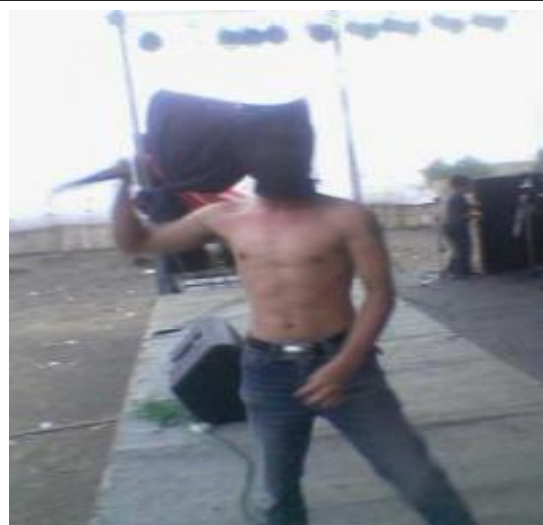
“Hell To Pay”-Converge