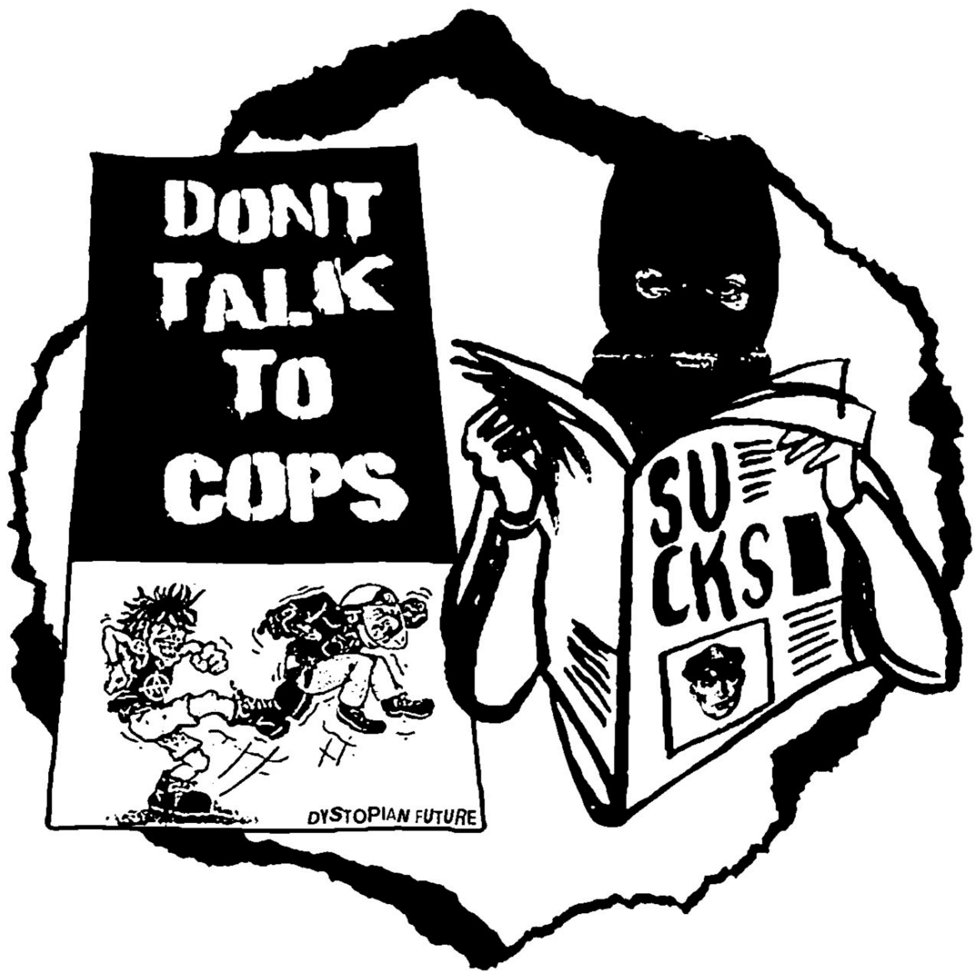
ARTWORK DYSTOPIAN FUTURE