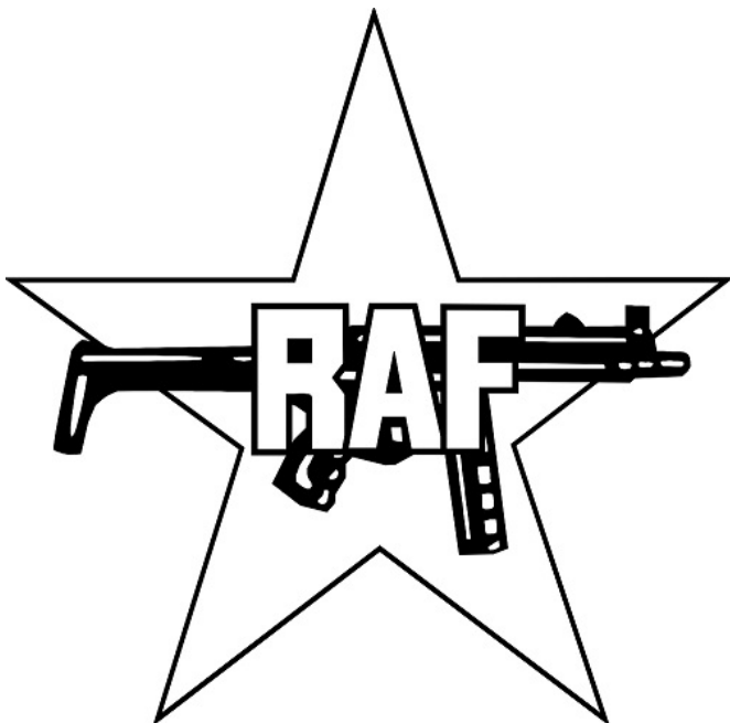
Logo Tentara Merah Jerman (RAF) dengan senjata mitraliur semi otomatis favorit mereka, Heckler & Koch MP5

Inilah alasan mengapa kaum gerilyawan kota menggunakan perjuangan bersenjata, dan mengapa mereka terus mengkonsentrasikan upaya-nya pada pemusnahan fisik agen-agen penindas, dan mendedikasikan diri 24 jam sehari untuk melakukan perampasan terhadap kaum penghisap rakyat.