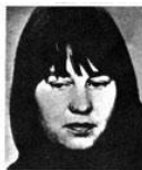
Meinhof, Ulrike, gesch. RÖH, 7. 10. 34 Oldenburg Haltbockl