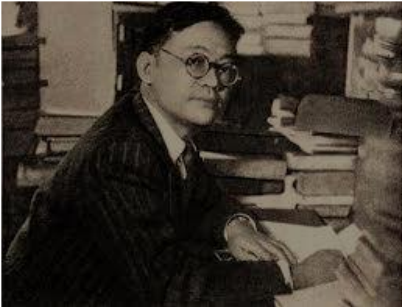
Ba Jin (Li Yaotang)

*Ekspedisi Utara adalah kampanye militer yang dilakukan oleh Kuomintang antara tahun 1926-1928 dengan tujuan untuk menyatukan Tiongkok di bawah pemerintahan Nasionalis Kuomintang yang dipimpin oleh Chiang Kai-Shek.