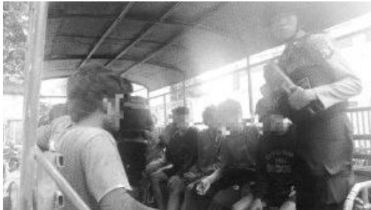
11 warga Maba Sangaji dijadikan tersangka atas aksi penolakan terhadap PT. Position

Melalui tuduhan semacam itu, kekuasaan berniat mengalihkan perhatian publik dari akar persoalan sebenarnya—perampasan tanah dan kerusakan ekologis—sekaligus mendelegitimasi amarah kolektif warga dengan mencapnya sebagai “aksi tunggangan”. Tak berhenti di sana, beberapa hari setelah siaran pers tersebut, pemerintah desa setempat juga mengeluarkan surat pernyataan yang menyebut bahwa sebelas warga yang ditahan bukan bagian dari komunitas adat. Tujuannya jelas: menggambarkan mereka sebagai pelanggar hukum serta melemahkan solidaritas masyarakat.