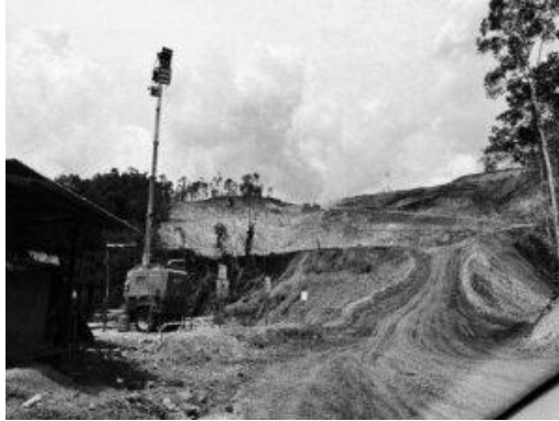
Salah satu kawasan hutan adat di Maba Sangaji yang dirusak oleh PT. Position

Desember 2024, warga mempertanyakan aktivitas tambang ke perangkat desa, namun tak ada jawaban. Beberapa hari kemudian, perwakilan PT POS datang bukan untuk menjelaskan, tapi merekrut pekerja dan menawarkan “tali asih” senilai Rp2.500/m 2 untuk lahan seluas 730 hektar—nominal yang tidak sebanding untuk nilai ekonomi dan ekologis bagi masyarakat Maba Sangaji. Warga pun menolak: tanah adat bukan untuk dijual.