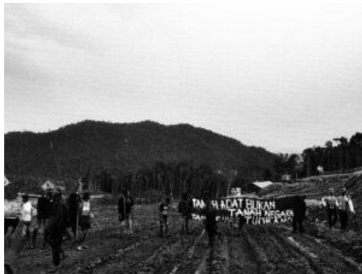
Tanah Adat di Maba Sangaji, Halmahera Timur, Maluku Utara.