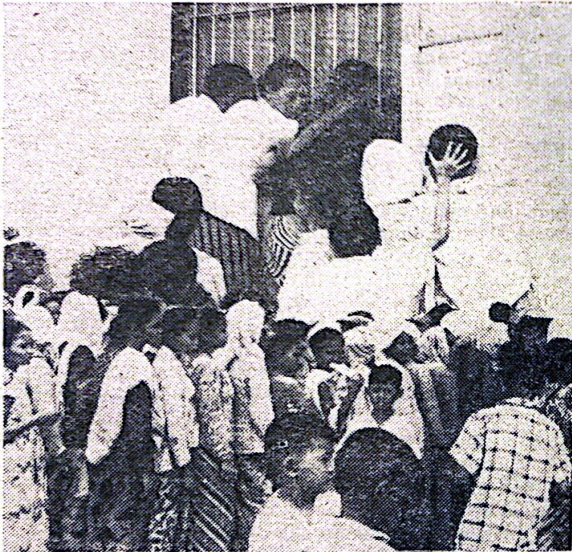
Pemandangan didepan suatu Toko Sandang-Pangan

Majoritet jang sangat terbesar dari massa wanita adalah jang paling tertindas hidupnja sebagai akibat daripada krisis ekonomi jang terusmenerus menjengeram negeri kita. Mereka adalah korban pertama daripada meradjalelanja pengangguran, kemiskinan, keterbelakangan, ketidakadilan ekonomi dan sosial dinegeri kita. (D.N. Aidit)