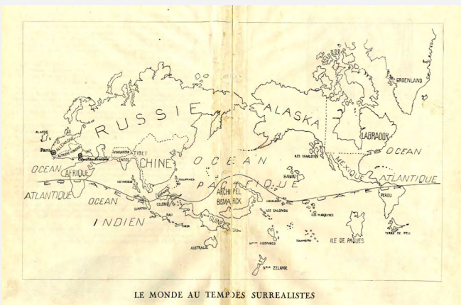
Surrealist Map of the World, Yves Tanguy, 1929

Coba kita kesampingkan sejenak dua manifesto Breton. Hubungan antara surealisme dengan politik masih bisa ditelisik secara produktif melalui tulisan-tulisan politis mereka, contohnya ketika mereka secara aktif mendukung perjuangan anti-imperialisme di Vietnam dan perjuangan anti-kolonialisme di Aljazair melalui korespondensi serta aksi solidaritas. 7 Karya pelukis surealis Yves Tanguy ' Surrealist Map of the World ' misalnya, juga bisa dijadikan contoh lain atas komitmen mereka terhadap politik dan perjuangan kaum tertindas. Dalam karya tahun 1929 itu, Tanguy menggambarkan sebuah peta dunia, di mana ia dengan sengaja menghilangkan seluruh bagian Eropa (kecuali kota Paris) dan Amerika Serikat, sebagai bentuk kritik dan pernyataan politis atas Negara kebangsaan yang masa lalunya berdiri di atas darah kekerasan-kekerasan kolonial dan kekuasaan imperialis. Melalui penjelajahan di antara keterkaitan surealisme dengan politik, atau lebih tepatnya, komitmen mereka terhadap politik anti-kolonial di seluruh dunia, kita dapat memahami bagaimana surealisme berupaya untuk menggabungkan kritik, humor, dan upaya subversif dalam tiap proses produksi karya seni mereka. 8