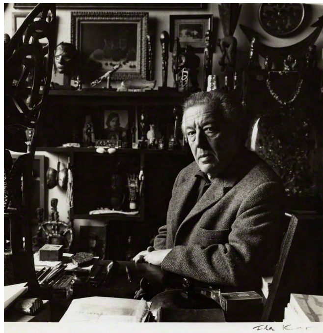
André Breton and His Collections

Bagaimana caranya salah satu pendiri gerakan surealisme yang terkenal dengan jargon dan retorika perjuangan, bisa menjustifikasi tulisan anti-kolonialnya? Mengingat partisipasi Breton dalam pasar pertukaran objek seni non-Barat—pasar yang keberadaannya didasari pada perampasan-perampasan kolonial—bukanlah sekedar kebetulan.