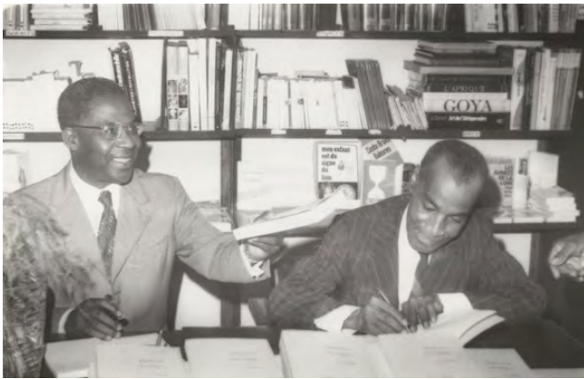
Aimé Césaire dan Léon-Gontran Damas

Césaire mengadopsi ide dan bekerja mengikuti tradisi realis, tetapi caranya yang spesifik turut membawa pertanyaan-pertanyaan mengenai kolonialisme dan subjektivitas kolonial dalam pergerakan surealisme ke permukaan. Isu tematik yang dibawa Césaire yang dengan gigih berupaya untuk mencari latar belakang historis antara Eropa dan Afrika, bisa lebih memberikan kita pemahaman terhadap kondisi historis. Yaitu kondisi di mana teori subjektivitas revolusioner yang memadai bagi pelaksanaan proyek komunis, adalah teori yang juga secara simultan berupaya untuk mengatasi kolonialisme dan segala dampaknya di Dunia Ketiga, juga tentu masih berkaitan erat dengan reproduksi kapital.