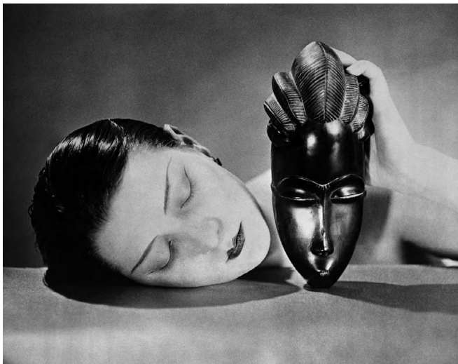
Noire et blanche, Man Ray, 1926

Perkembangan teoretis Césaire sangat dipengaruhi oleh pertemuan pertamanya dengan surealisme ketika masa pendidikannya di Paris. Sebagai individu berkulit hitam yang mengalami krisis identitas kolonial, ia tak punya pilihan banyak selain mengutuk hipokrisi