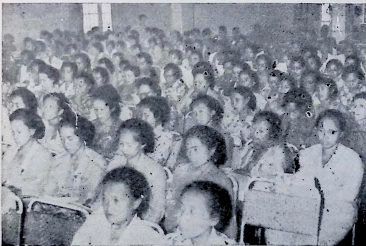
Para pengikut seminar asjik mengikuti djalannja Seminar.