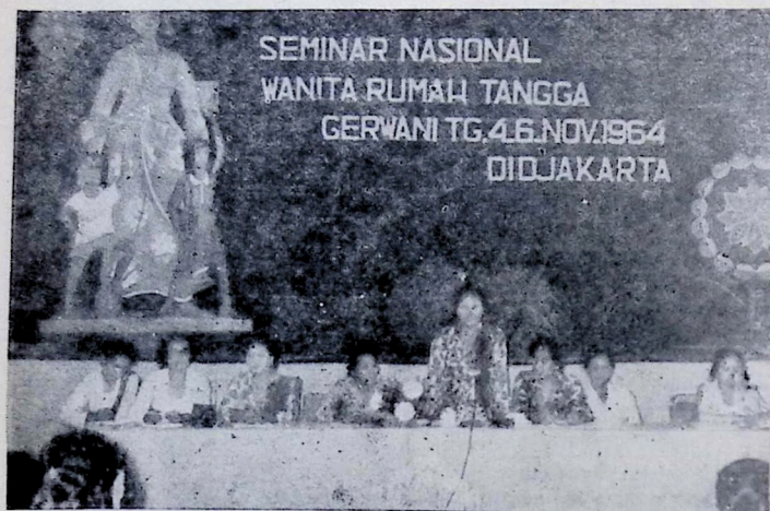
D.P.P. Gerwani pada pembukaan Seminar.